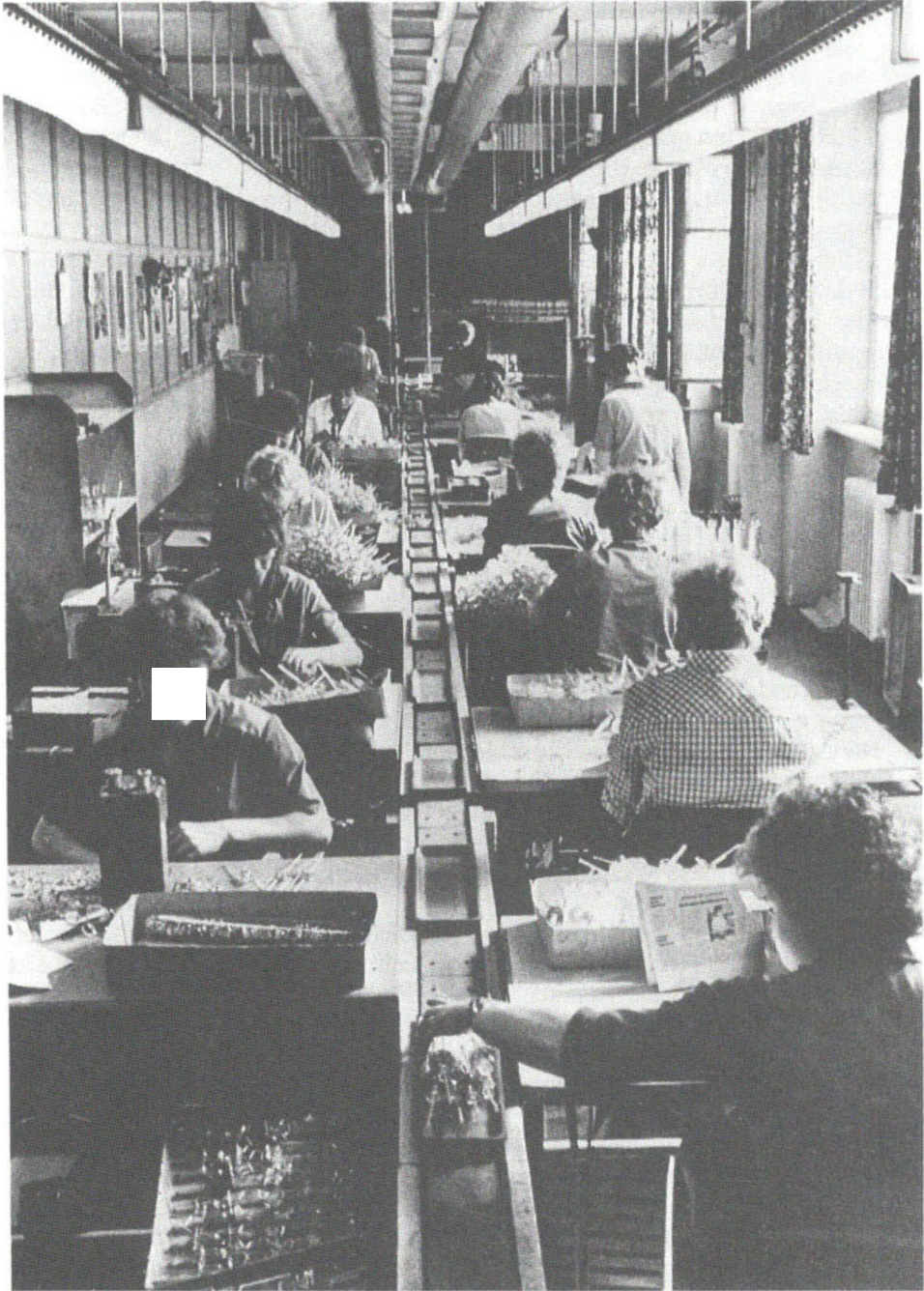
Glas braucht behutsame Hände ... Die Technologie bestimmt hier die Sitzordnung, der zugekehrte Rücken hat nichts mit dem Verhältnis der Frauen untereinander zu tun