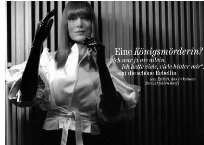
Abb. 2: Gabriele Pauli

Zum Vergleich bietet sich das „Latex-Bild“ (Abb. 2) der ehemaligen CSU-Politikerin und Landrätin von Fürth Gabriele Pauli an. Das Foto ist kein Schnappschuss, sondern wurde für eine Modestrecke mit Frau Pauli im Hochglanzmagazin Park Avenue inszeniert. Zu diesem Zeitpunkt (Anfang 2007) war Frau Pauli medial sehr präsent, da sie die Diskussion über die Spitzenkandidatur des damaligen Bayerischen Ministerpräsidenten Edmund Stoibers bei den nächsten Landtagswahlen entscheidend vorange- trieben hatte. 9