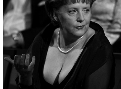
Abb. 1: Angela Merkel

Es existiert eine ganze Serie von Fotografien, die Frau Merkel in einem ausgeschnittenen Abendkleid zeigen, das sie anlässlich der Eröffnung der neuen Oper in Oslo trug. Eines dieser Bilder (Abb. 1) wurde besonders häufig reproduziert, sowohl Online als auch in den Printmedien. Angela Merkel ist in der Halbnahen zu sehen, d.h. Brust- und Kopfbereich sind abgebildet. 5 Dies entspricht der natürlichen Sehsituation in der Interaktion mit anderen Menschen und wird deswegen