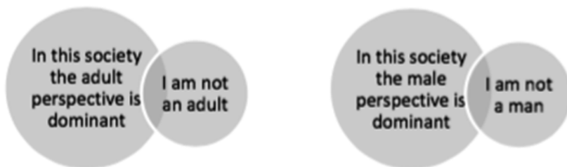
Abbildung 3: EASO-Abbildung zur gruppenspezifischen Norm und Macht

Im vierten Schritt wird die Thematik um die Elemente der Gruppenzugehörigkeit (group membership) und gesellschaftliche Machtgefälle zwischen Gruppen erweitert. Als Abweichung von der Norm kann also nicht nur ein bestimmtes faktisches oder gesellschaftlich zugeschriebenes Verhalten, sondern auch die Zugehörigkeit zu einer marginalisierten oder stigmatisierten gesellschaftlichen Gruppe gelten.