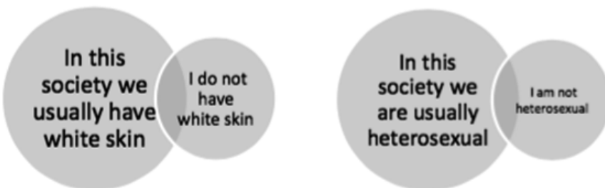
Abbildung 2: EASO-Abbildung zu genderspezifischen Normen

Nonkonformität mit Normen wird dabei als aktiver, aber auch als zugeschriebener Bruch mit einer gesellschaftlichen Norm definiert. Personen, die gesellschaftlichen Mehrheitsnormen nicht entsprechen, werden als „NormbrecherInnen“ (norm breaker) definiert, „a person who through their appearance, identity or behaviour does not conform to one or several norms“ (ebd.). Die Definitionen weisen damit durchweg auf Normen als soziale Konstruktionen und Andersartigkeit als Zuschreibungsprozesse hin. Davon ausgehend wird im zweiten Schritt die Abweichung von der Mehrheitsnorm im Kontext von Gender erläutert und in Zusammenhang mit selbstgewählten oder zugeschriebenen Identitätsmerkmalen gebracht.