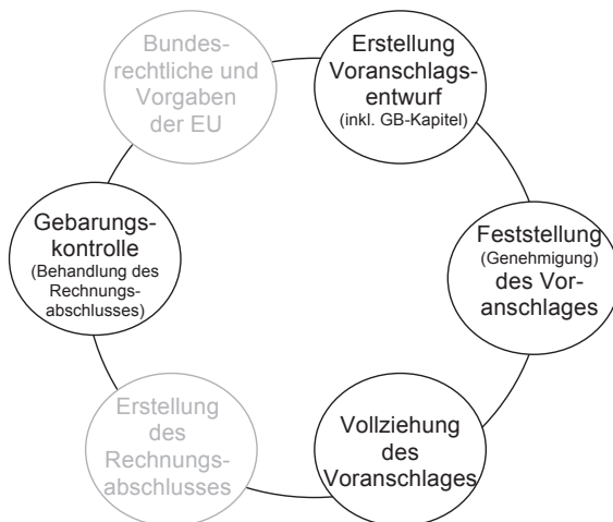
Abbildung 1: Budgetkreislauf für Wien

einer radikalen geschlechterdemokratischen Erweiterung von Finanzpolitik denkbar und intendiert. Um den Kriterienkatalog an den Budgetprozess herantragen zu können, muss dieser zunächst in unterschiedliche Phasen aufgespaltet werden. Hierfür bietet sich die Darstellung des Budgetprozesses als Budgetkreislauf an. Damit können die Abschnitte des budgetpolitischen Entscheidungsprozesses dargestellt und feministische Demokratisierungsimpulse auf inhaltlicher, institutioneller und prozessualer Ebene in die verschiedenen Phasen des Kreislaufes eingearbeitet werden. Dies soll im Folgenden beispielhaft anhand des Wiener Budgetkreislaufes dargestellt werden. Bei dem Wiener Budgetprozess 6 handelt es sich um einen sich jährlich wiederholenden Kreislauf mit vier grundsätzlichen Phasen, der Erstellung, Verabschiedung, des Vollzug und der Kontrolle, die in Abbildung 1 um die zwei vorgelagerten Phasen »Bundesrechtliche und Vorgaben der EU« und »Erstellung des Rechnungsabschlusses« 7 erweitert wurden.