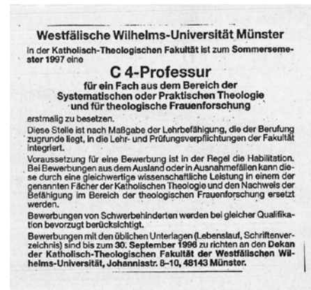
In: Die Zeit, Nr. 32, 1. August 1997. BU: Die dritte – erfolgreiche – Ausschreibung galt einem Fach aus der Systematischen oder der Praktischen Theologie oder den Bibelwissenschaften in Verbindung mit Theologischer Frauenforschung.

migung an das Wissenschaftsministerium weiter, aber von dort kam im April 1999 ein Erlass, dass man dem nicht zustimmen könne. In der Begründung hieß es, die Bezeichnung mit Feministischer Theologie habe bekanntlich kirchlicherseits einen „gewissen Reizcharakter“. Erneut also ein Machtkampf zwischen Staat und Kirche, und erneut sah die Fakultät keinen anderen Weg als zwar Protest gegen diese Begründung anzumelden, aber sich letztlich zu beugen – das Seminar erhielt den Namen „Seminar für Theologische Frauenforschung“.