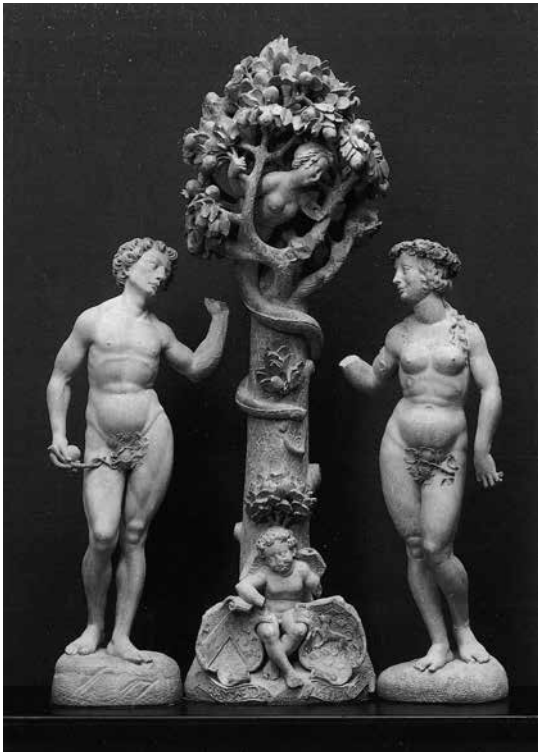
Johann Brabender, Adam und Eva unter dem Paradiesesbaum, LWL-Museum für Kunst- und Kulturgeschichte.