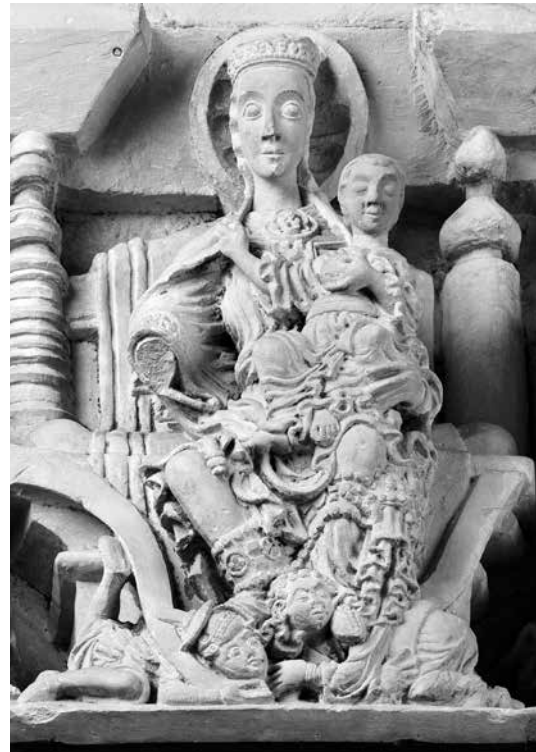
Das Marienrelief im Paradies der Kathedrale St. Paulus, Baumberger Sandstein, H: 82 cm, B: 186 cm, T: 55 cm (Foto: Stephan Kube).

Jahrtausende hinweg erhalten hat; die Geste versinnbildlicht den Sieg des Herrschers über seine Feinde. Diese Herrschaftsideologie liegt auch dem biblischen Psalm 110 zugrunde, wenn Gott dem König Israels zuspricht: „Ich werde Dir deine Feinde als Schemel unter Deine Füße legen“ (Ps 110,1). Zu Jesu Zeiten wurde dieser Psalm auf den kommenden Messias gedeutet (vgl. Mt 22,41–45; Mk 12,35–37; Lk 20,4–44), eine Deutung, der sich das spätere Christentum anschloss. Für das Münsteraner Marienrelief ergibt sich damit die Aussage: Maria ist Himmelskönigin und zugleich Thron ihres Sohnes, des Messias, und zusammen triumphieren sie über ihre Feinde. Bei der linken Gestalt ruht der Fuß der Himmelskönigin nicht auf deren Rücken, sondern auf dem Kopf, sodass diese Gestalt auf den Boden gedrückt und fast zermalmt wird. Dieser Zug der Darstellung wird verständlich, wenn man nun auch die Geschichte von Adam, Eva und der Schlange, die biblische Paradiesgeschichte, hinzuzieht. Im Urteilsspruch Gottes über die Schlange heißt es ja: „Weil du das getan hast, bist du verflucht unter allem Vieh und allen Tieren des Feldes. Auf dem Bauch wirst du kriechen und Staub fressen alle Tage deines Lebens. Feindschaft setze ich zwischen dir und der Frau, zwischen deinem Nachwuchs und ihrem Nachwuchs. Er wird Dir den Kopf zertreten, und Du wirst ihm nach der Ferse schnappen“ (Gen 3, 14–15) – ich habe hier bewusst näher an dem Wortlaut übersetzt, der im Mittelalter, aber auf