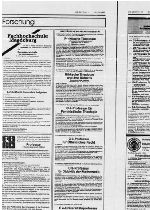
In: Die Zeit, Nr. 31, 24. Juli 1992. BU: Zuerst wurde die Ausschreibung einer C4-Professur für „Feministische Theologie“ an der Katholisch-Theologischen Fakultät der Universität Münster bekanntgegeben.