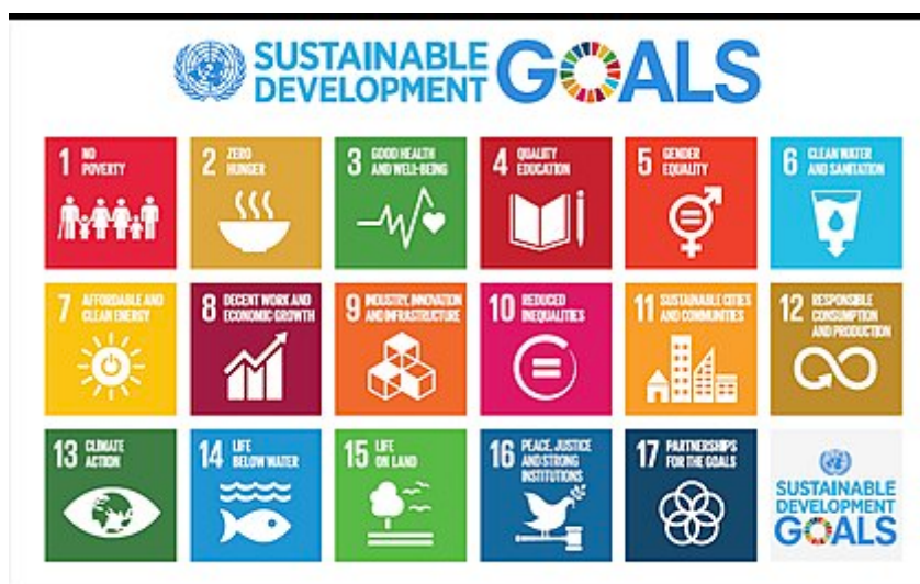
Abbildung 2. Die 17 Sustainable Development Goals