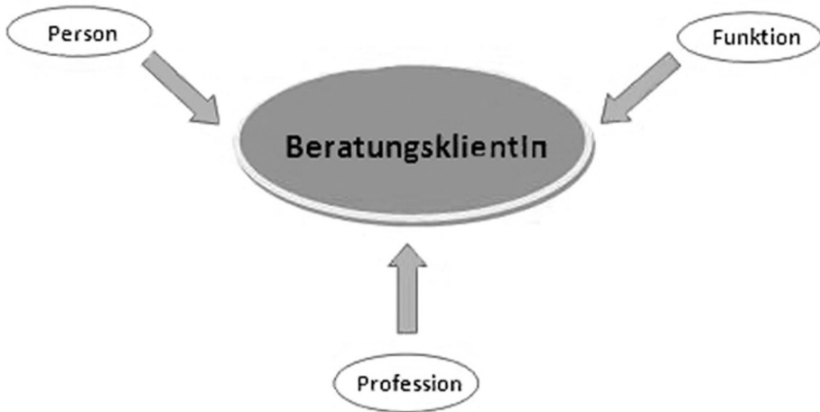
Abbildung 1: Basistriade der Beratungsklientin bzw. des Beratungsklienten

Zentral für das triadische Denken ist zudem die Idee der Prämierung eines Faktors zu einem Zeitpunkt gegenüber den beiden anderen Faktoren, das heißt, die Bevorzugung eines Faktors auf Kosten der anderen (vgl. Rappe-Giesecke 2008: 36f., 40). Dieser der Ökologie entlehnten Vorstellung liegt die Endlichkeit von Ressourcen zugrunde.