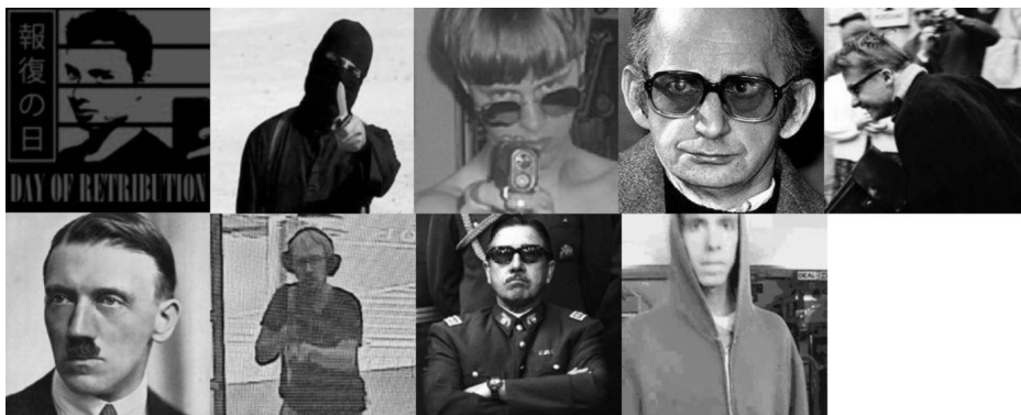
Abbildung 5: Profilbilder von Nutzern, die einen Amokläufer, Terroristen, Serienmörder, Vergewaltiger und/oder gewaltsamen Diktator zeigen