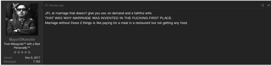
Abbildung 2: Screenshot Beitrag #6 zum Thread: „1993 The Beginning of a Sexless Marriage“