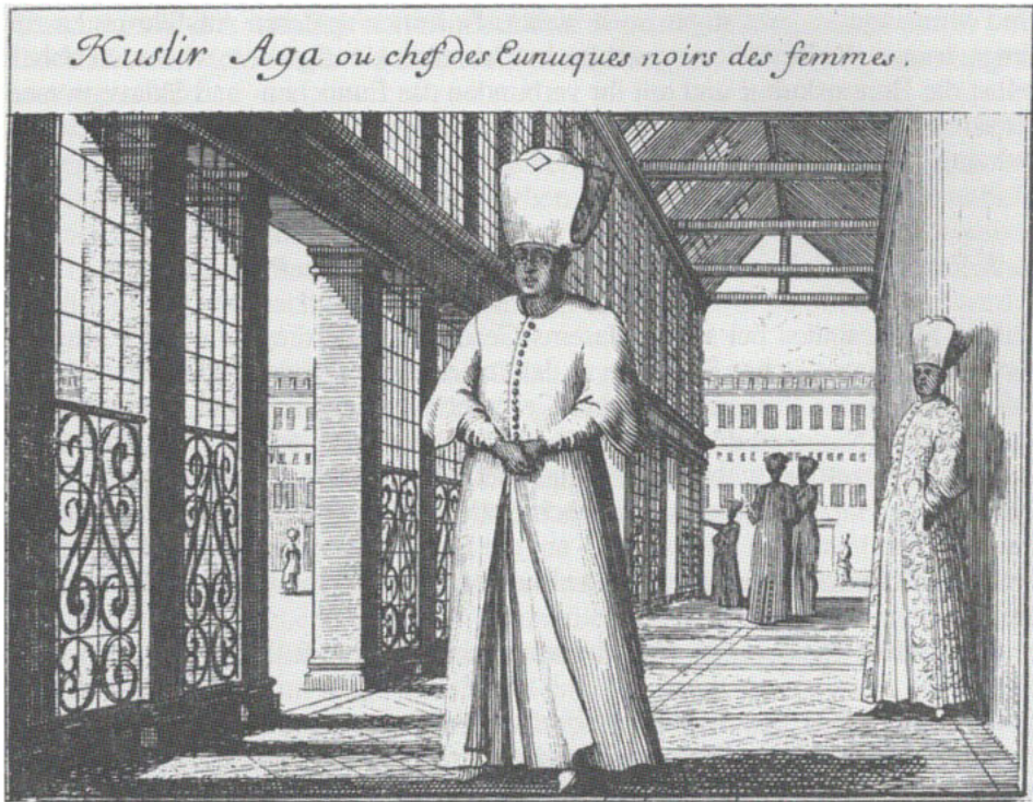
Sebastien Leclerc: Kuslir Aga oder Chef der schwarzen Eunuchen . Kupferstich aus einer Folge mit exotischen Trachten von 1669–1675 (Nürnberg, German. Nationalmuseum)

remonieell wurde (schließlich) vollzogen, und man führte das Mädchen gewaltsam ins Bett. Eine Stunde später aber stand der Nichtsnutz wütend auf, versetzte dem Mädchen mehrere Schnitte ins Gesicht und erklärte, sie sei keine Jungfrau mehr. Darauf schickte er es zu seinem Vater zurück. Man kann nicht schwerer beleidigt werden, als es ihm hiermit widerfahren ist. (68. Brief, S. 133)