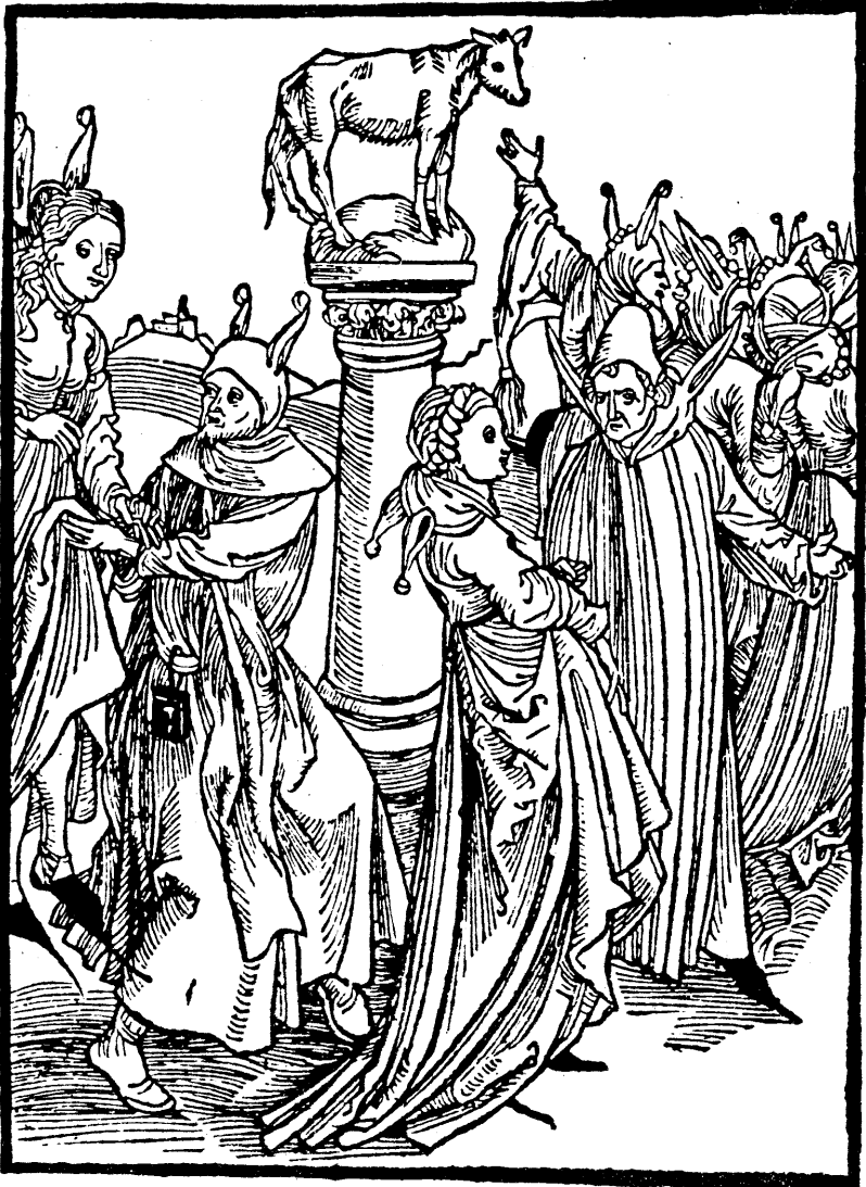
Abb. 1: Holzschnitt Nr. 61 aus dem Narrenschiff von Sebastian Brant 1494 Das Bild zeigt, daß die, die um das Stierbild herumtanzen, Narren sind, Widersacher der christlichen Religion.