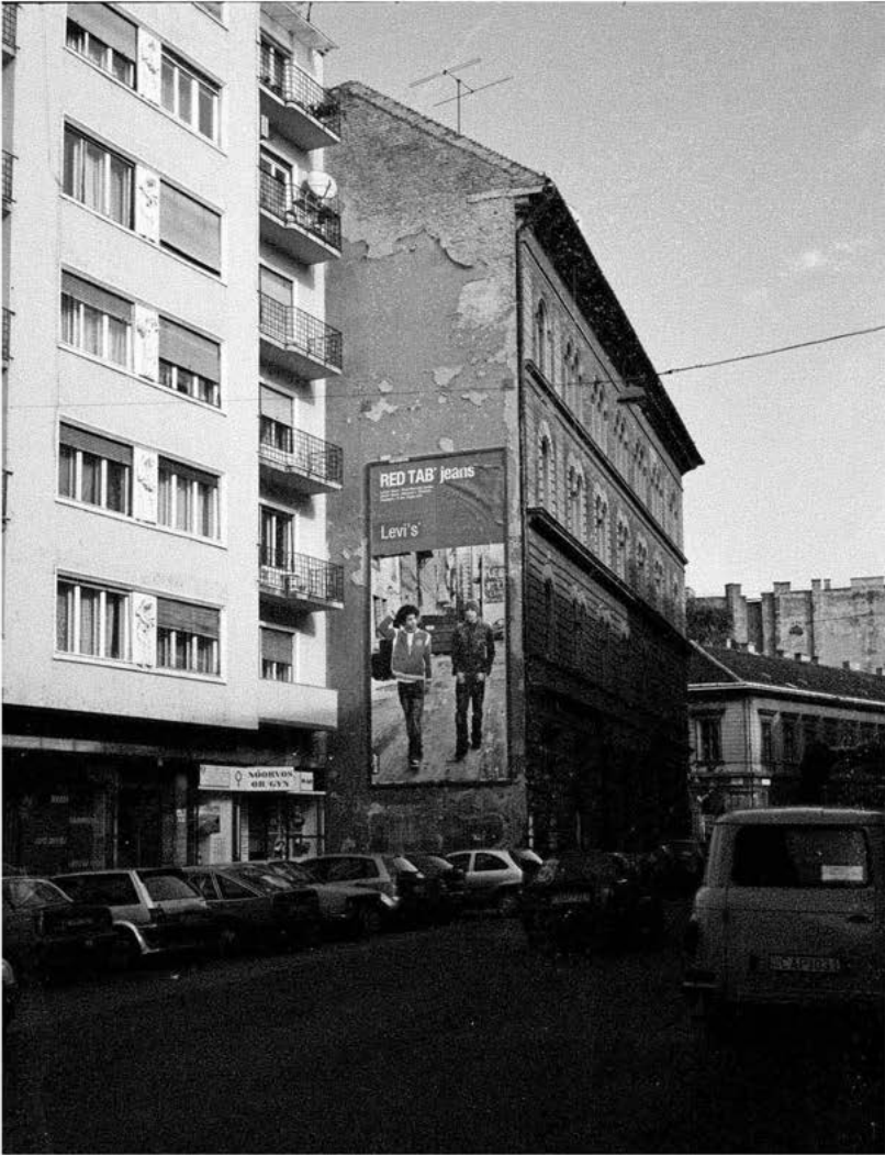
global players: Budapest