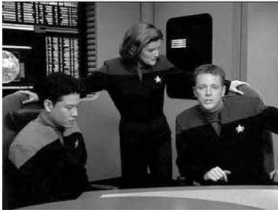
Aus: VOY 5x15: Das ungewisse Dunkel I