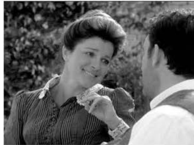
Aus: VOY 6x11: Fair Haven

Die depressive Janeway weigert sich in der Episode Nacht 9 – ohne Uniform und mit strähnigen Haaren – die Verantwortung für Schiff und Crew zu übernehmen. Auffällig ist, dass die Derangiertheit (auch bei anderen weiblichen Figuren) immer vor allem an den Haaren festgemacht wird, die als Zeichen für sittsame oder erotisierte und daher auch »ordentliche« oder »unordentliche« Weiblichkeit gelten. (Vgl. Mühlen Achs 2003: 96)