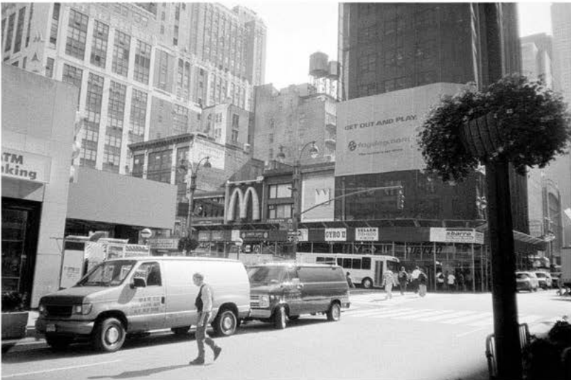
global players: New York