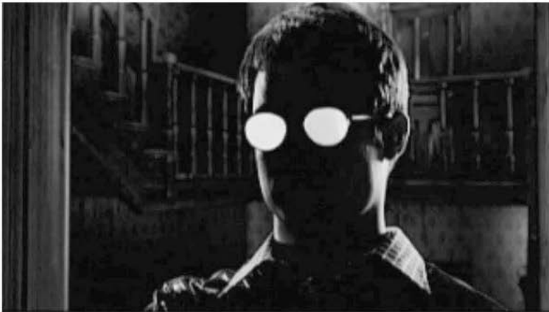
Aus: Sin City