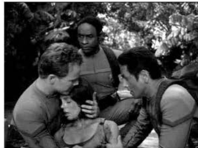
Aus: VOY 3x16: Pon Farr

Paris' und Torres' spätere Verbindung und Ehe führt zu einer ›Zähmung‹ der wilden Klingonin, was sich bereits in Pon Farr abzeichnet. Durch ihre Partnerschaft lernt sie, sowohl ihre klingonische Seite zu akzeptieren als auch sie zu kontrollieren. Aus dem Action Girl wird eine liebende Ehefrau und vorbildliche Mutter in spe. In der letzten Voyager -Folge 22 wird die einst so waghalsige wie aktive Torres vollends auf die Mutterrolle reduziert. Sie arbeitet