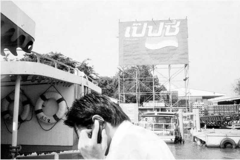
global players: Bangkok