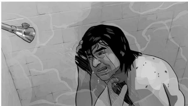
Aus: A Scanner Darkly

A Scanner Darkly bewegt sich in seiner Bildästhetik immer in dieser alle Grenzen einreißenden Uneindeutigkeit und schafft damit eine radikal grafische Körperinszenierung. Das Ergebnis sind Körperbilder, in denen die visuelle Inszenierung der Schauspieler zwischen zweidimensionaler Zeichnung und dem Eindruck, dass sie in einem dreidimensionalen Raum agieren, changiert. Hier liegt der entscheidende Unterschied zu allen früheren Mischfilmen, in denen der Schauspielerkörper visuell nie ein Teil der gezeichneten Bildanteile war, sondern lediglich gemeinsam mit grafischen Objekten im Bild gezeigt wurde – wobei die Grenzen zwischen der Körperlichkeit der Darsteller und der Zweidimensionalität der Zeichnungen immer deutlich erkennbar waren. Dies hat sich in allen oben besprochenen Filmen grundsätzlich geändert – der Körper der Schauspieler wird hier als ein Grafikelement unter anderen inszeniert und behandelt.