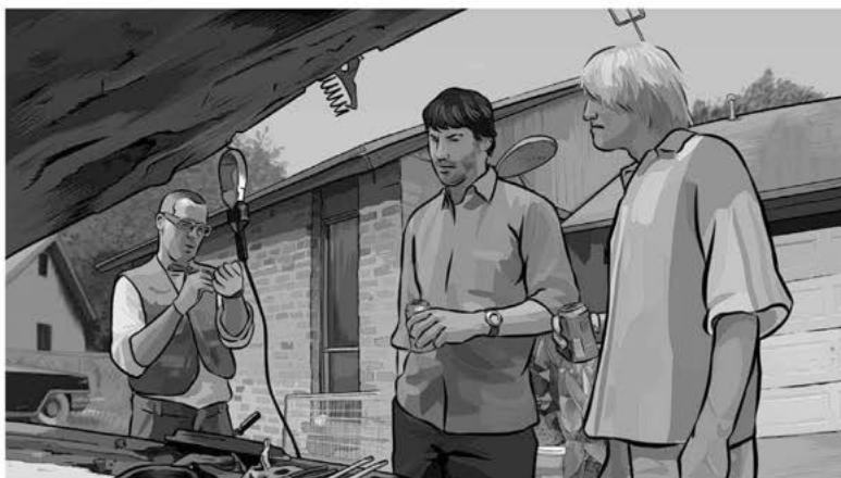
Aus: A Scanner Darkly

Dieser Look wurde in zwei Schritten erreicht. Zunächst wurde der Film wie jeder andere Spielfilm in Studiosets und an Außendrehorten mit den Schauspielerinnen und Schauspielern gefilmt und aus dem Material ein Rohschnitt gefertigt. In einer zweiten Phase wurden alle Bilder des Films mit Hilfe einer Zeichensoftware Bild für Bild regelrecht übermalt und Hintergründe, Objekte, Körperteile nachträglich animiert. 12 Mal dominiert das Zeichnerische und der Film vermittelt das Gefühl, dass alle Bildanteile animiert sind, mal sind »unter« den Zeichenelementen sehr deutlich die Körper der Schauspieler und die Spielorte zu erkennen, so dass die Nähe zum Spielfilm sichtbar wird. So glaubt z.B. einer der Figuren der Eröffnungssequenz des Films im Drogenwahn, dass sein Körper von kopflausähnlichen Insekten bevölkert wird. Seine vielfachen Versuche, sich von dem Ungeziefer zu befreien, sind jedoch erfolglos. Bemerkenswert an der Inszenierung seines Kampfes mit den nicht-existenten Insekten ist die sichtbare Hybridität der Bilder: Während Teile des Körpers immer wieder an ihre eigentliche Räumlichkeit erinnern und deutlich zu erkennen ist, dass hier ein Schauspieler vor der Kamera gestanden hat, sind andere Körperteile – insbesondere der Kopf und die Haare als Ausgangspunkt der Kopflausinvasion – ganz deutlich als grafisches, am Computer gezeichnetes Element zu erkennen: Im Gegensatz zum Rest des Körpers erscheinen diese Partien grundsätzlich flächig.