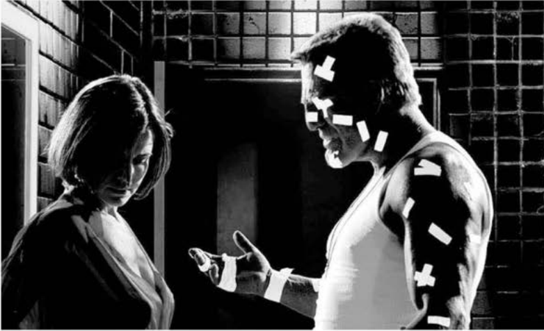
Aus: Sin City