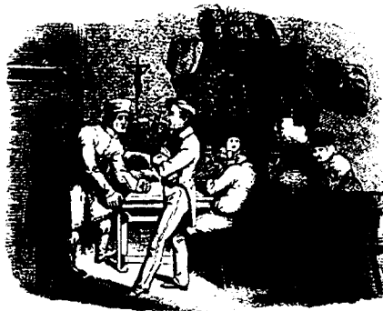
Von August Ellrich.

(Verfasser des Werks: „Die Ungarn wie Sie sind.“)