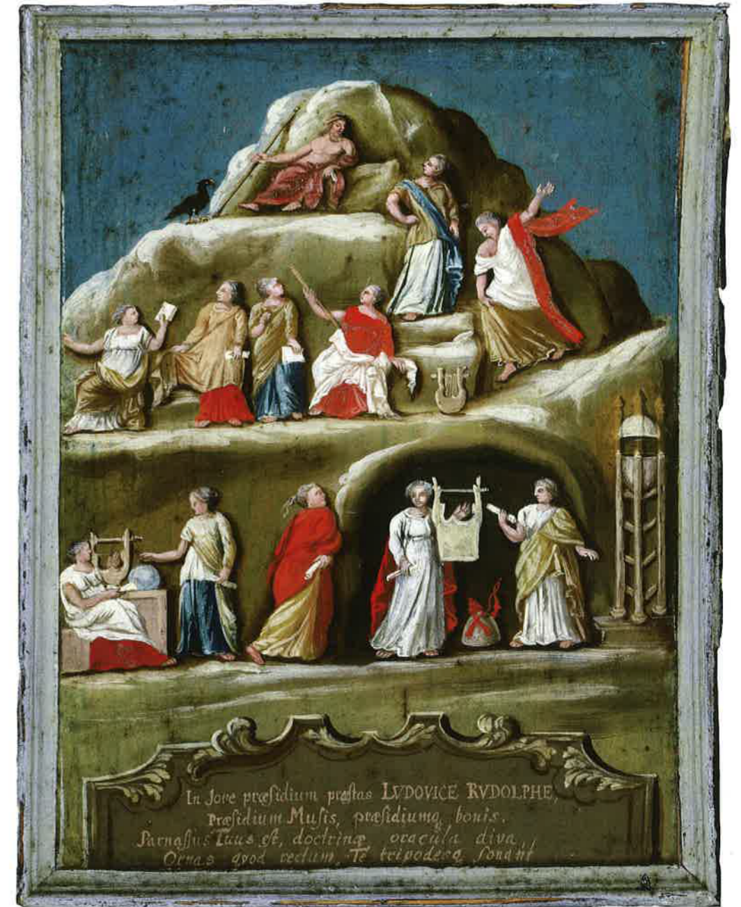
Abb. 81: Die Musen auf dem Parnass, hier in den Elm-Wald verlegt; mit Jupiter, Herzog Ludwig Rudolph und Apollon (1731), HAB B 91