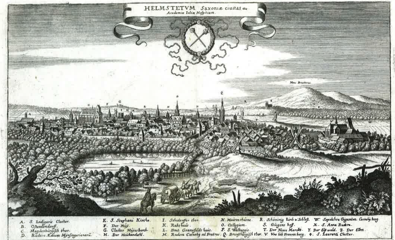
Abb. 69: Helmstedter Stadtansicht von Nordosten (1654), Kupferstich von Conrad Buno, Verlag Matthaeus Merian Erben, NLA-StA WF 50 Slg 1033, Nr. 2

Schon Herzog Heinrich d. J. hatte in seinem Testament dem Land 5 000 Reichstaler zur Errichtung einer höheren Schule in Alfeld vermacht, das erst 1523 nach der Hildesheimer Stiftsfehde zum Fürstentum Braunschweig-