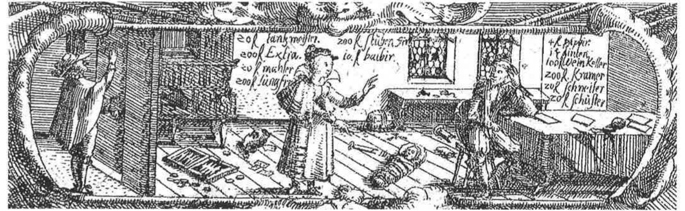
Abb. 72: Detail aus Delineatio vitae Academicæ (um 1620), Kupferstich v. Andreas Brettschneider, HAUM ABretschneider AB 3.1, vgl. Abb. 32

Die Hochzeitsdichtungen bedienten sich eines antiken Figurenrepertoires und so wurde die Academia Julia zum Sitz der Musen. Die eheliche Verbindung stellte insgesamt das wichtigste Element dar, durch das die Geschlossenheit der Gruppe hergestellt wurde. 14 Die akademischen Bestattungsreden (Funeralprogramme), die feierlich vom Prorektor vor dem akademischen Senat vorgetragen wurden, beinhalteten für die Druckfassung, ähnlich wie bei gedruckten Leichenpredigten, eine ausführliche Vita der Verstorbenen mit einer detaillierten Einordnung in das Universitätsumfeld. Eine große Anzahl der Funeralprogramme können gegenwärtig über das Forschungsportal der virtuellen Universität Helmstedt ( http://uni-helmstedt.hab.de/ ) recherchiert werden. Für Margarete Schrader (1647–1680), Tochter des Helmstedter Professors Christoph Schrader und seit 1669 Ehefrau des Professors für Rechtswissenschaften Georg Engelbrecht d. Ä. (1638–1705), die 33-jährig elf Tage nach der Geburt des sechsten Kindes starb, hielt der Prorektor