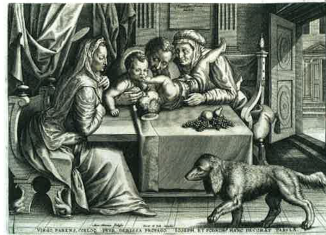
Abb. 71: „Heiligen Familie“ mit Elisabeth und Johannes dem Täufer (Ende 16. Jhd.), Kupferstich nach Franz Floris von Antonie Wierinx, HAB Graph. A1: 2809f

nungspflicht der Ehefrau gegenüber dem Ehemann. 9 Die Familie mit dem verheirateten Ehepaar und Kindern war zur Basis der neuen gesellschaftlichen Ordnung geworden. Diese gesellschaftliche Veränderung fand auch in der Kunst ihren Ausdruck. Bis etwa 1500 wurde die menschliche Abstammung des Gottessohnes stets über die genealogische Abstammung von Maria und deren Mutter Anna hergeleitet und im Motiv der so genannten „Anna selbdritt“ bildlich dargestellt. Nach der Reformation wird die menschliche Abstammung des christlichen Erlösers durch das Motiv der „Heiligen Familie“, Josef, Maria und Kind, ersetzt.