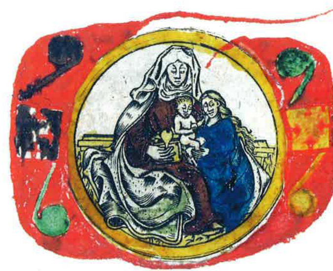
Abb. 70: Anna selbdritt-Motiv in der Initiale eines handschriftl. Gebetbuchs (um 1475), Kupferstich, handkoloriert, HAB Cod. Guelf 1293 Helmst., Bl. 322 r

Die Familiarisierung von Arbeit und Leben war ein fundamentaler Vorgang in der Frühen Neuzeit, und das Ehe- und Arbeitspaar wurde zum Kern eigenständiger Haushalte in allen Schichten. 8 Insofern ist die Reformation keineswegs ein allein frömmigkeitsgeschichtlicher Einschnitt, sondern präziser kann sie als religiös fundierter, sozialer, rechtlicher und kultureller Umbruch gefasst werden. Der klösterliche hortus conclusus bestand nicht mehr und Frömmigkeit war forthin untrennbar mit den innerweltlichen Lebens- und Arbeitsformen verbunden. Frauen wie Männer sollten heiraten, gemeinsam für das Auskommen ihrer Kinder sorgen und diese zu frommen, arbeitsamen Christen zum Nutzen der Gesellschaft erziehen. Die Moralisierung von Haushalt und Familie wurde rechtlich festgeschrieben und definierte eine wechselseitig symmetrische Unterstützungspflicht der Eheleute bei gleichzeitig hierarchisch geformter Unterord-