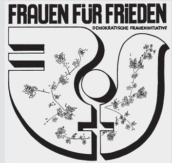
Logo der DFI; AddF, ST-29 ; 1-2

Der Bestand enthält u.a.: Protokolle, Korrespondenzen, Pressemitteilungen des Zentralen Arbeitskreises, Unterlagen zu Orts- und Regionalgruppen; Unterlagen u.a. zu den Themen: Internationaler Frauentag / Muttertag, diverse Friedensaktionen, Weltfrauenkonferenzen, Antiapartheid, Zusammenarbeit mit der Internationalen Demokratischen Frauenföderation.