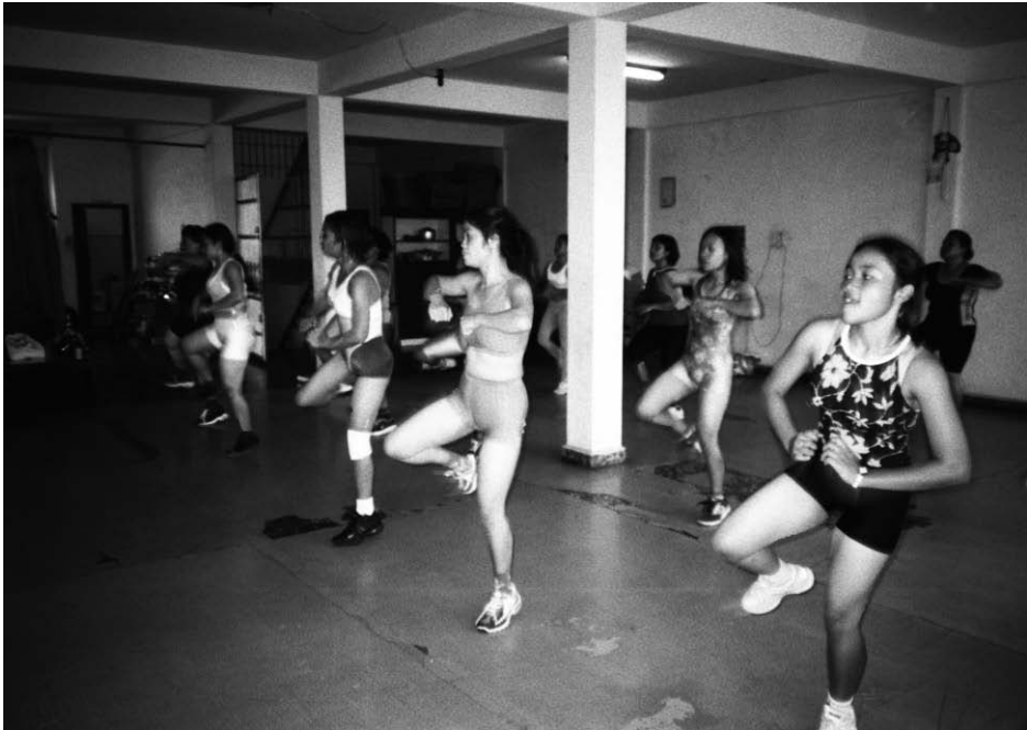
Abb. 18: Aerobic-Kurs im Studio Barsim.

Die Studios sind in der lokalen Wahrnehmung hierarchisch klar gegliedert. Abgesehen von der Größe erschlossen sich mir die Kriterien dieser Hierarchie allerdings zunächst nicht. Die Unterschiede, so lernte ich bald, beruhen zum einen auf der Persönlichkeit der jeweiligen Besitzerinnen und auf der ökonomischen Potenz der Mitglieder, die sie anziehen bzw. durch ihre Preisgestaltung anziehen wollen. Nina Fitness galt unzweifelhaft als das mondänste Studio, Barsim als gehobener Standard und Studio Nomi als normal ( sederhana ). Die beiden neuen Studios konnten noch nicht klar eingeschätzt werden, aber Fajar Fitness mit seinen neuen Trainingsgeräten hatte nach Einschätzung meiner Gesprächspartnerinnen das Potential, sich recht schnell oben anzusiedeln.