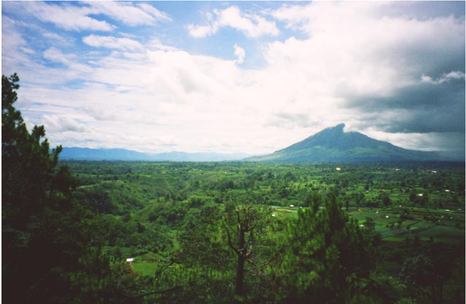
Abb. 1: Blick von Berastagi über die Hochebene auf den Vulkan Gunung Sinabung.

Kipp 1996:141ff). Mit Kolonialismus und Mission setzen jedoch für mein Thema relevante Prozesse wie die Christianisierung und die spätere Einbindung in den postkolonialen Nationalstaat ein.