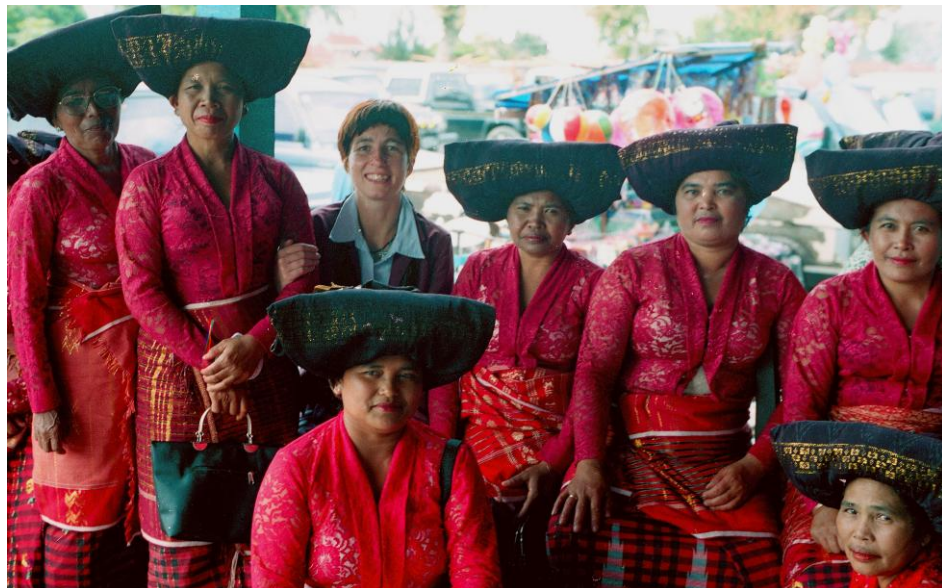
Abb. 21: Eine Gruppe weiblicher Verwandter bei einer Hochzeit mit aufeinander abgestimmter roter Festkleidung: eine Bluse kebaya, ein golddurchwirkter sarong, ein um die Hüfte gewickelter, ebenfalls golddurchwirkter Schal ulos (K), die traditionelle Kopfbedeckung tudung (K) – sowie eine unpassend gekleidete Ethnologin.

schicke Sandaletten mit hohen Absätzen etc. Bei diesen Anlässen wird mit der Qualität der Kleidung, die während und nach dem Fest Anlass zu ausgiebigen Diskussionen gibt, der eigene Status unter Beweis gestellt. 326