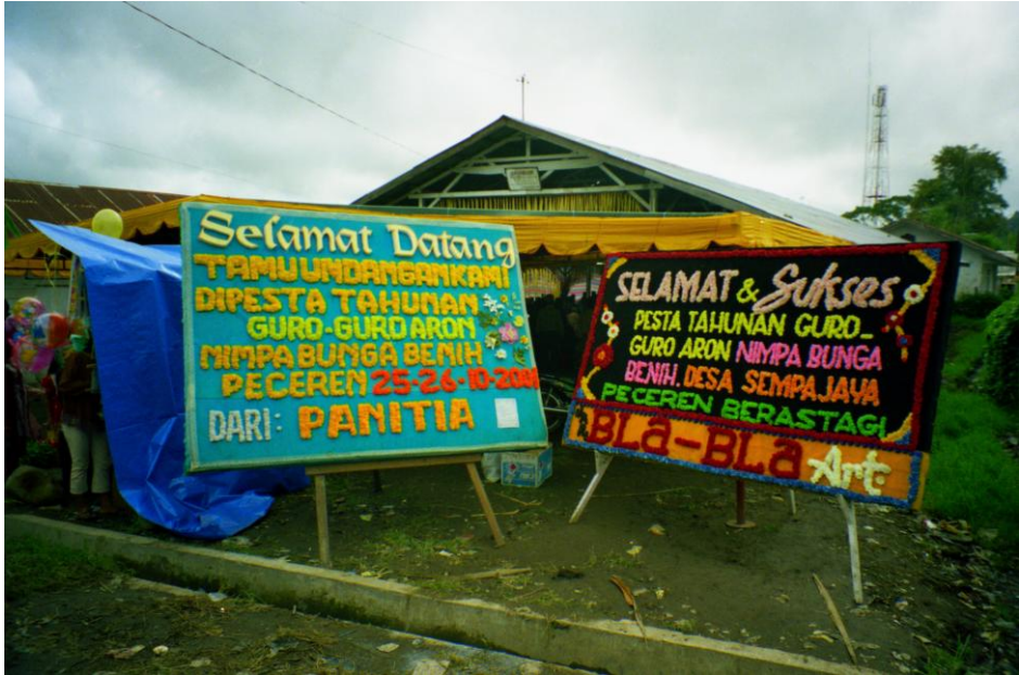
Abb. 16: Aus Kunstblumen gesteckte Grußtafeln beim Erntefest im Dorf Peceren.

und der Name des Absenders mit kleinen bunten Kunstblumen gesteckt werden. 270