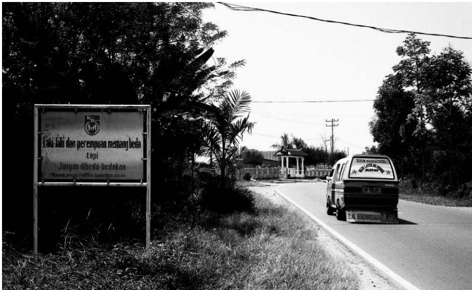
Abb. 6: Die regionale Dependence der staatlichen Familienplanungsbehörde mahnt an der Hauptstraße zwischen Berastagi und Kabanjaha: „Männer und Frauen sind in der Tat verschieden, aber lasst sie uns nicht unterschiedlich behandeln!“.

Ben, Verwaltungsgebäuden etc. investieren. 89 Am Straßenrand rufen Schilder dazu auf, vereint für Fortschritt und Entwicklung zu arbeiten: „Ordnung und Sauberkeit bedeuten Fortschritt!“, „Lasst uns gemeinsam den Verkehr sicherer machen!“, „Zwei Kinder im rechten Abstand ermüden die Mutter nicht und halten sie jung!“, „Drogen sind die Quelle von AIDS!“, „Eine saubere Stadt ist eine schöne Stadt!“. Vor dem Gebäude des Familienwohlfahrtsamtes sind auf einer großen Tafel alle Ziele des PKK-Programms säuberlich aufgeführt, das Jahrbuch für Statistik listet akribisch auf, welche Verhütungsmethoden von wie vielen (verheirateten) Paaren im Rahmen der staatlichen Familienplanung auf der Hochebene angewendet werden. Als BürgerIn der Hochebene ist man stets dazu aufgerufen, sein Verhalten zu überprüfen, gegebenenfalls zu korrigieren, sich zu engagieren und seine Handlungsfähigkeit in den Dienst des Fortschritts der Nation zu stellen, wengleich die Bedeutung der Nation im Kontext der Dezentralisierung ebenso am Verbleichen ist wie die Beschriftung der Tafeln, auf denen zum Dienst an ihr aufgerufen wird.