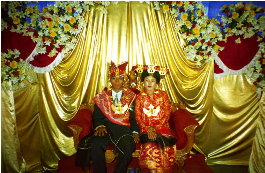
Abb. 15: Braut und Bräutigam bei der adat-Hochzeit.

Der tudung für eine Hochzeit ist ein komplexes Gebilde, das aus einem eng um den Kopf gewickelten Stoffrest, einem ulos 269 , schwarzem Stoff, Zeitungspapier zum Ausstopfen und sehr vielen Sicherheitsnadeln besteht. Nach dem kunstfertigen Aufbau ziert den Kopf der Braut anschließend ein voluminöses Gebilde, das über der Stirn eine gerade, waagrechte Linie bildet und nach hinten leicht aufsteigend in einer Spitze endet. Dazu wird auch ose-ose emas (K), der mehrteilige traditionelle goldene Schmuck für Braut und Bräutigam vermietet, der aus einzelnen großteiligen Elementen besteht, die am tudung befestigt werden, und aus einer Halskette mit einem großen, massiven Anhänger in Form eines Vogels auf Höhe der Brust.