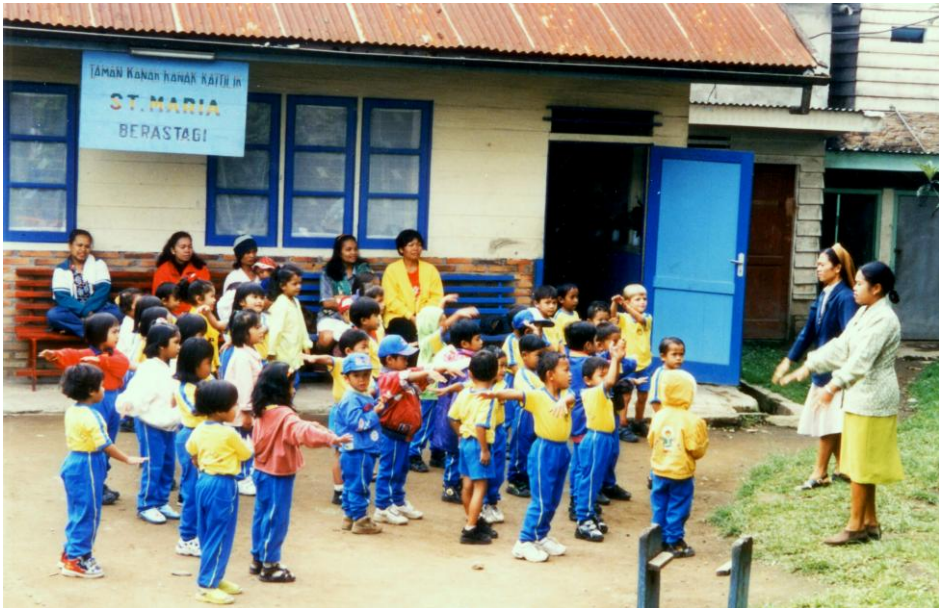
Abb. 17: Die Kinder des katholischen Kindergartens St. Maria in Berastagi bei der freitäglichen Morgengymnastik in Sportuniform.

durchgeführt wurden. Die exakten Übungen wurden – mit Musik und gesprochenen Anweisungen unterlegt – als Kassetten an die Institutionen verteilt. 278 Im Fernsehen traten die bekannten Trainerinnen mit Gruppen von Kindergartenkindern, Behördenbelegschaften oder Teilnehmerinnen eines lokalen Familienwohlfahrtsprogramms auf und unterstrichen so den Charakter der Sendungen als Erziehung zur Volksgesundheit.