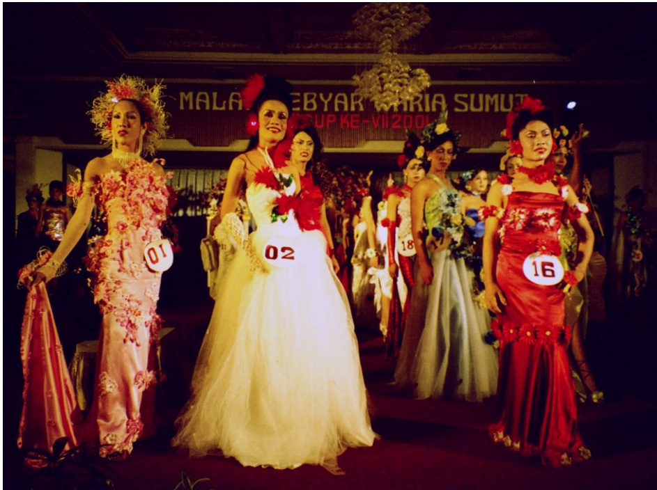
Abb. 28: Parade der Teilnehmerinnen an der Miss-Wahl zur ‚Waria-Blumenkönigin von Nord-Sumatra‘ 2001.

Auch in anderer Hinsicht knüpfen sie nahtlos an lokale Vorstellungen von Weiblichkeit an: Als besonders fähige Schönheitsspezialistinnen erfüllen sie die kulturellen Erwartungen an die Arbeitsfähigkeit von Frauen. Viele Besitzerinnen von salons erklärten, dass waria über ein weitaus größeres professionelles Wissen und bessere Fertigkeiten als sie selbst verfügten und ‚von Natur aus‘ die besseren Schönheitsspezialistinnen seien. Andere Frauen erwähnen immer wieder, dass man als Braut am Morgen vor der eigenen Hochzeit unbedingt zu einer waria gehen solle, wenn man wirklich gut zurechtgemacht werden möchte. Auch die persönliche Schönheitsspezialistin des Landrats und seiner Frau war eine waria .