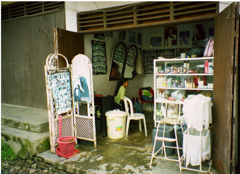
Abb. 11: Rizna's Beauty Salon am Obstmarkt in Berastagi. Der rote Eimer vorne links dient dem Ausspülen der Haare nach der Haarwäsche.

Heute ziehen sich salons die Hauptstraße von Berastagi und die zentralen Straßen von Kabanjahe entlang, weitere konzentrieren sich um die großen Märkte der beiden Städte sowie um den Obstmarkt in Berastagi. Da viele ohne Steueranmeldung arbeiten, sind offizielle Zählungen nicht zuverlässig. In Berastagi existierten zu Beginn meiner Feldforschung 18 salons . Im Laufe des Jahres kamen drei Neueröffnungen dazu. Im weitaus unübersichtlicheren Kabanjahe existierten geschätzte 60 salons . Sie haben Namen wie Arwella Beauty Salon , Sofyani Saloon [sic!], Favorit Prima Beauty Salon , Aneka Mode Salon , Rindy Salon Kecantikan – Beauty Salon etc. 264