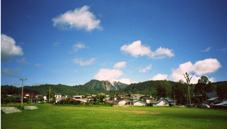
Abb. 5: Blick über das Fußballfeld von Berastagi auf den Vulkan Gunung Sibayak.

die Studierenden aus Medan, die am Wochenende den Gunung Sibayak , quasi den Hausvulkan der Stadt, besteigen und sich anschließend in den heißen Quellen an seinem Fuß erholen, in den billigen Pensionen oder im Zelt übernachten. 73