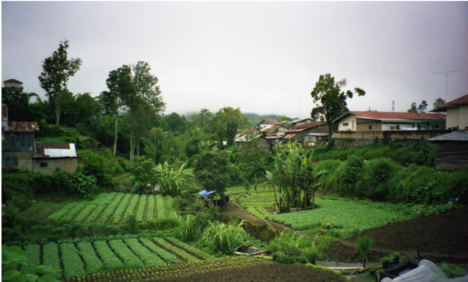
Abb. 2: Felder am Stadtrand von Berastagi.

Die Produktion verschiedener Obst- und Gemüsesorten unterliegt starken Schwankungen, die vor allem durch die veränderte Nachfrage, plötzlich auftretende Pflanzenkrankheiten und die große Innovationsfreudigkeit der Landwirte verursacht werden. 63 Das unebene Gelände, das kleine Felder bedingt, erlaubt keinen Einsatz von schwerem landwirtschaftlichen Gerät, macht aber eine intensive Bewirtschaftung notwendig. Werbung und Produkte von transnationalen Agrar-Konzernen wie Bayer, Aventis, Monsanto etc. sind in den Dörfern und Städten omnipräsent. Geschäfte für Düngemittel sowie Herbizide und Pestizide säumen die Geschäftsstraßen von Kabanjahe und Berastagi, die auch die zentralen Umschlagplätze für den Handel mit Agrarprodukten sind, die bis nach Java, Malaysia und Singapur exportiert werden. Tanah Karo ist aufgrund der erfolgreichen