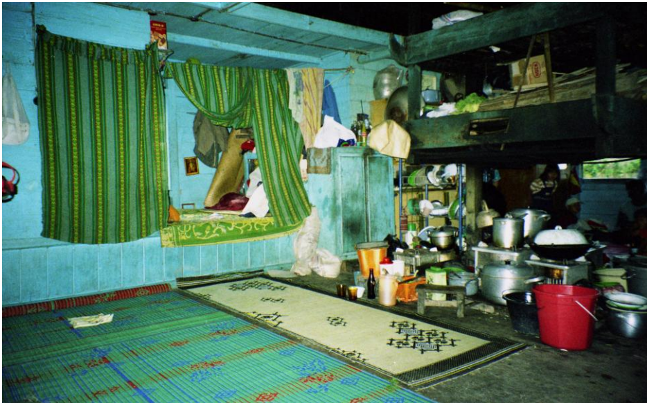
Abb. 7: Die Wohninheit einer Familie in einem noch bewohnten Langhaus. Rechts im Bild die übersichtliche Haushaltsausstattung.

für die Region in zweidimensionaler Form auf zahlreichen Prospekten und Drucksachen auftaucht und dreidimensional gerne die Glockentürme von Kirchen ziert. „Wenn man hier wirklich etwas Interessantes für Touristen machen möchte“, so meinte Amin, der in dem spärlich bestückten Informations-Büro des staatlichen Amtes für Tourismus arbeitete, „muss man wirklich ganz von vorne anfangen. Was sollen wir denn bei einem cultural evening machen?“ Das nach eigenem Verständnis konstitutive Merkmal kultureller Identität, das Verwandtschaftssystem der fünf Klane, ließ sich nicht touristisch vermarkten.