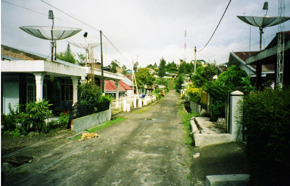
Abb. 4: Straße in Kejora, einem wohlhabenden Wohnviertel von Berastagi, mit funktionslosen Satellitenschüsseln.

mehr möglich ist. 68 Die in Berastagi und Kabanjahe ubiquitären Satellitenschüsseln sind daher inzwischen obsolet. 69 Wer andere Programme als TVRI sehen möchte, den unbeliebten, weil immer noch als regierungstreu geltenden staatlichen Sender, muss sich einen kostspieligen digitalen Receiver kaufen, hat dann aber auch Zugang zu mehreren Dutzend internationalen Programmen. 70