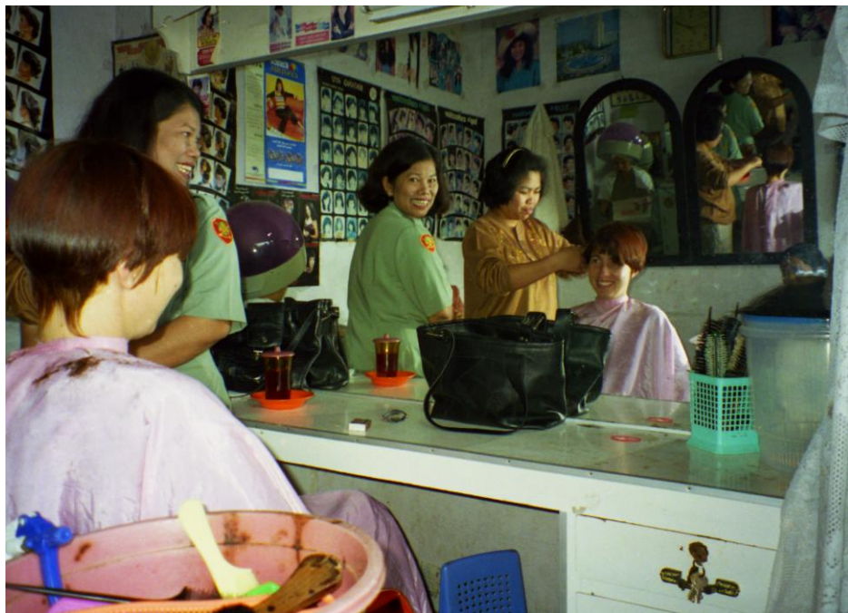
Abb. 25: Der Ethnologin wird unter Anteilnahme von Passantinnen der Schnitt ‚Demi Moore‘ verpasst.