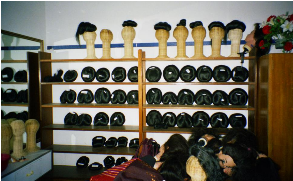
Abb. 9: Peddigrohrköpfe, Plastikmodelle und eine Kollektion von künstlichen sanggul (Haarknoten) im KWK.

Männer und Frauen sowie vier Privatzimmer für Angestellte des KWK um den begrünten Innenhof, der von einem offenen Laubengang gesäumt wird. Die zwei Unterrichtsräume sind mit Tischen, Stühlen und Wandtafeln möbliert. Der salon -Raum ist mit einer teilweise gesprungenen und blinden Spiegelwand, drei Sesseln mit – allerdings defektem – Wasserzulauf für die Haarwäsche und mehreren hochbeinigen Liegen aus Metall mit rotem Kunstlederbezug für Kosmetikbehandlungen ausgestattet. In einem Wandregal liegen aus Peddigrohr geflochtene Kopf-Modelle, an denen Haarteile befestigt und frisiert werden können. Die Wände sind mit Frisurenplakaten aus den späten 1980ern und frühen 1990er Jahren geschmückt. Der Unterrichtsraum für die Schneiderinnen ist mit Tret-Nähmaschinen ausgestattet, an der Wand hängen von den Schülerinnen genähte Modelle.