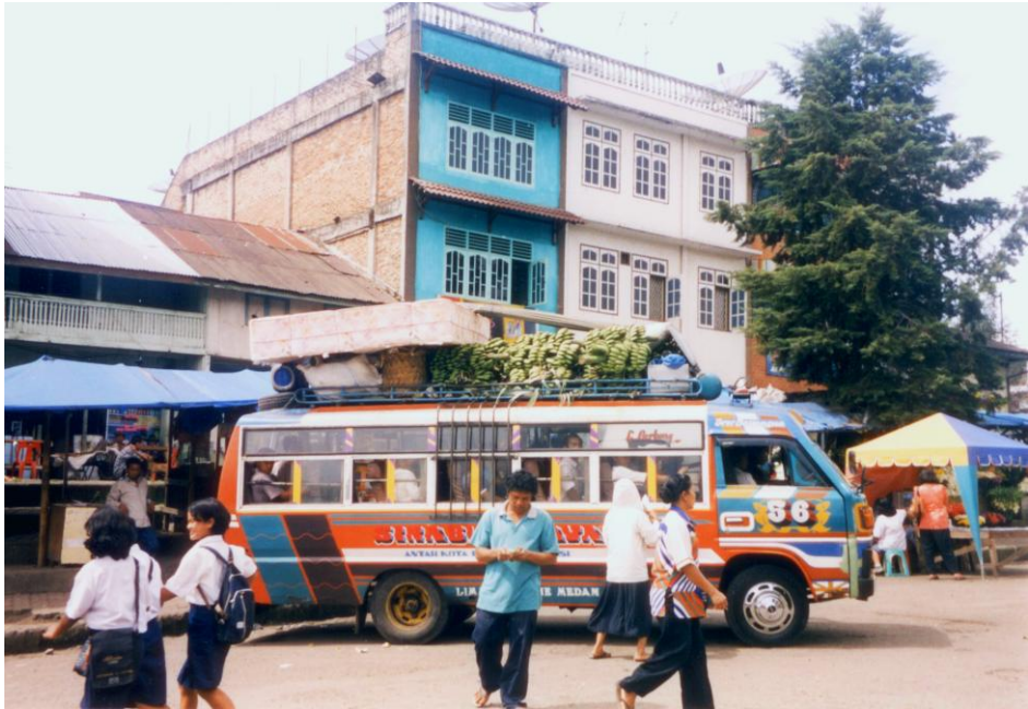
Abb. 3: Fruchtbare Fracht auf einem der zahllosen Busse, die Kabanjabe und Berastagi mit der Metropole Medan verbinden.

Hochebene. Mit mehr als 2000 BeamtInnen und noch einmal 2235 LehrerInnen arbeiten 1,7% der Bevölkerung in den Diensten des Staates und machen ihn damit zum größten Arbeitgeber der Hochebene (BPSKK 2000:24-25, 39).