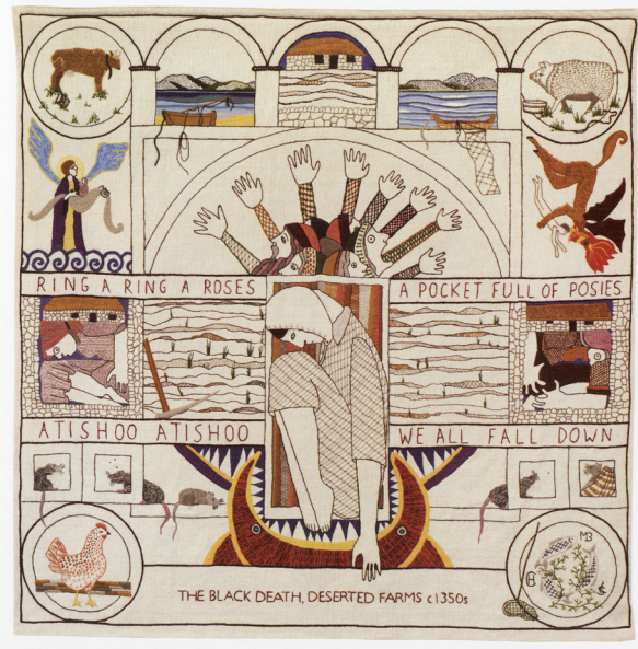
// Abbildung 5 Great Tapestry of Scotland, Panel 32: The Black Death. Deserted Farms c 1350's 2012–2013

23) Siehe dazu zum Beispiel auch Textilfeld 86 (Abb. 7).