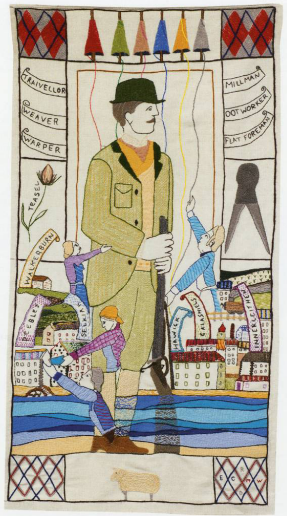
// Abbildung 7 Great Tapestry of Scotland, Panel 86: Borders Tweed, 2012–2013

Dieses in die Thematik der Great Tapestry einführende Textilfeld verbindet die Darstellung der Motive mit der Technik, in der es selbst gefertigt wurde. Die Figuren scheinen an der sie umgebenden Welt zu sticken und wirken im konkreten wie übertragenen Sinn an der mittels textiler Techniken evozierten Hervorbringung ihrer eigenen Geschichte mit. Mit dieser ‚Metastickerei‘ prägen sie zugleich das Bild, das die Betrachter*innen von Schottland gewinnen sollen.