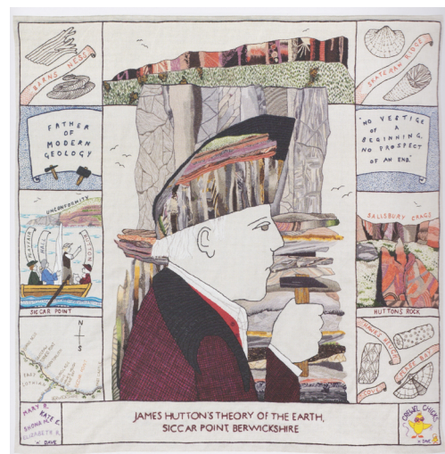
// Abbildung 6

Tweed ist ein dicht gewebter und robuster Stoff, der gut mit dem wechselhaften Klima Großbritanniens harmoniert. Traditionell wurde er beispielsweise auch zu sportlichen Aktivitäten wie der Jagd getragen, worauf auch das Gewehr hindeutet, auf das sich der Mann im Anzug stützt (Meyer zur Capellen 1996: 421).