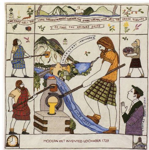
// Abbildung 4

Hier werden die Intentionen von Inklusion und einer Themenauswahl, die sich mehr auf das Leben der Einwohner Schottlands als auf Schlachten konzentrieren soll, klar formuliert. Dennoch entsteht natürlich am Ende ein Großprojekt, das mit seiner Version einer historischen Narration Geschichte konstruiert und bestimmte Ereignisse oder Werte memorieren will.