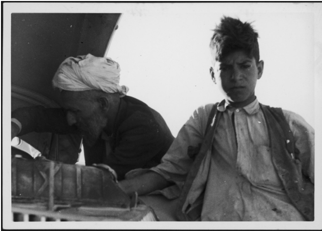
Annemarie Schwarzenbach, ohne Titel, 1939

Insbesondere die Aufnahme eines Automechanikers mit seinem Helfer lässt sich im Kontext des Motivs der Annäherung durch einen Kontakt zu den Menschen erläutern.