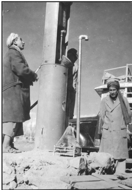
Annemarie Schwarzenbach, ohne Titel, 1939

Auf einer weiteren Fotografie des Bildberichtes ist eine Tankstelle dargestellt. Obwohl das Automobil im Bild fehlt, ist der fotografierte Ort eindeutig als für den Ford bestimmt konnotiert.