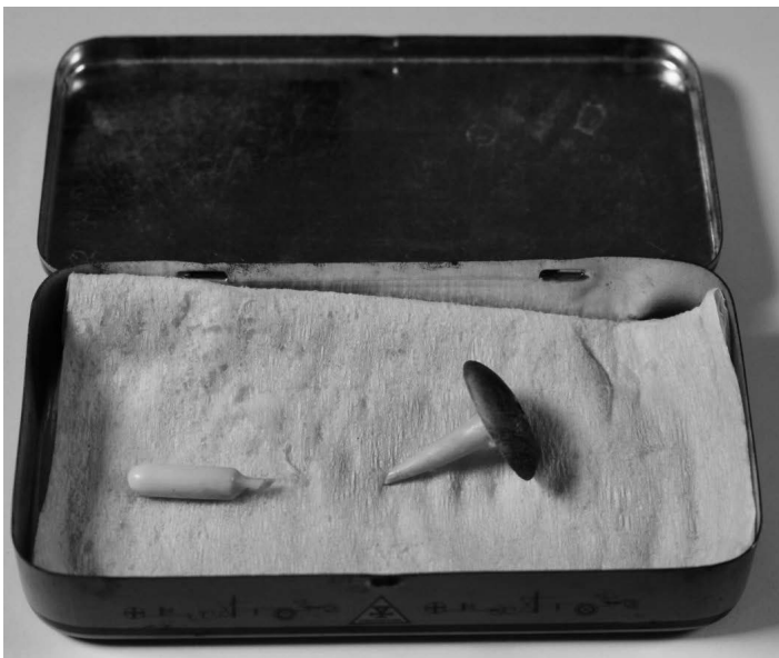
Abbildung 2.2: Innenansicht der Blechdose