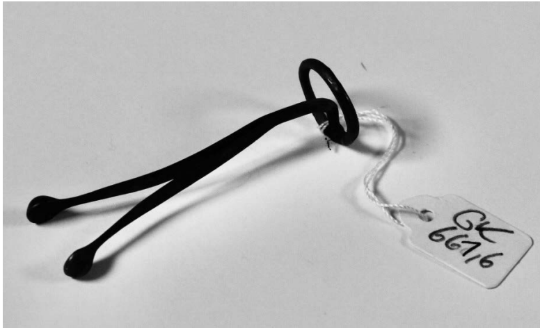
Abbildung 3.1: Spreizpessar