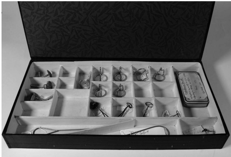
Abbildung 1: Kasten mit zunächst rätselhaften Objekten