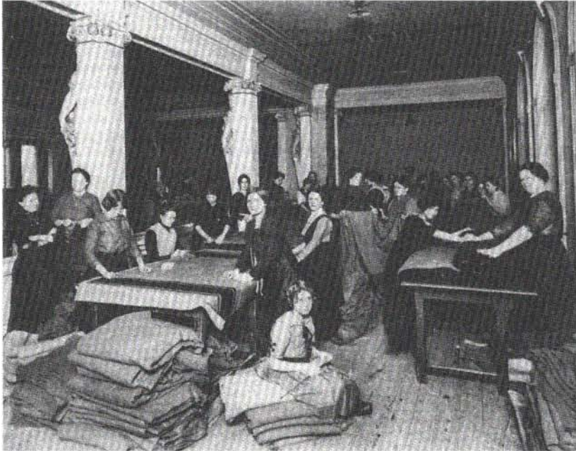
Abb. 5: Nähstube für Kriegsdecken, Foto des Heeresgeschichtlichen Museums, Inv. Nr. 39.558/5, aus: Svoboda, Soldaten, wie Anm. 13, Kat. Nr. 390.

stuben der Kontext zu jenem kriegerischen Begriff von „Liebe“ erspart. In den Pelz-, Näh- und Strickstuben verarbeiteten sie gespendete Liebesgaben , die u.a. von den genannten Sammelwagen eingebracht worden waren. Das in Abb. 6 reproduzierte Plakat „Der Sammelwagen kommt wieder!“ ruft zur Spende auch textiler „Liebesgaben für die Soldaten und ihre Angehörigen“ auf. Daß diese für die betreffenden Frauen der Unterschichten eine grundsätzlich andere, ökonomische, die karge Existenz sichernde Bedeutung hatte, eine andere als für die handarbeitenden Mädchen, die bürgerlichen Initiatorinnen und Leiterinnen der Arbeitstuben und die Spender/innen von Liebesgaben , muß sicher nicht ausführlich betont werden.