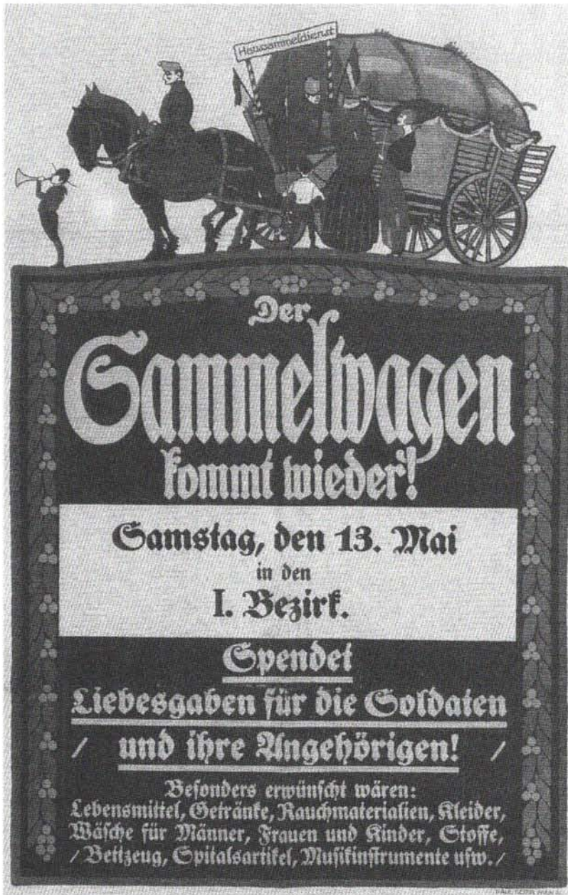
Abb. 6: aus: Denscher, Gold, wie Anm. 8, 53, Abb. 50.