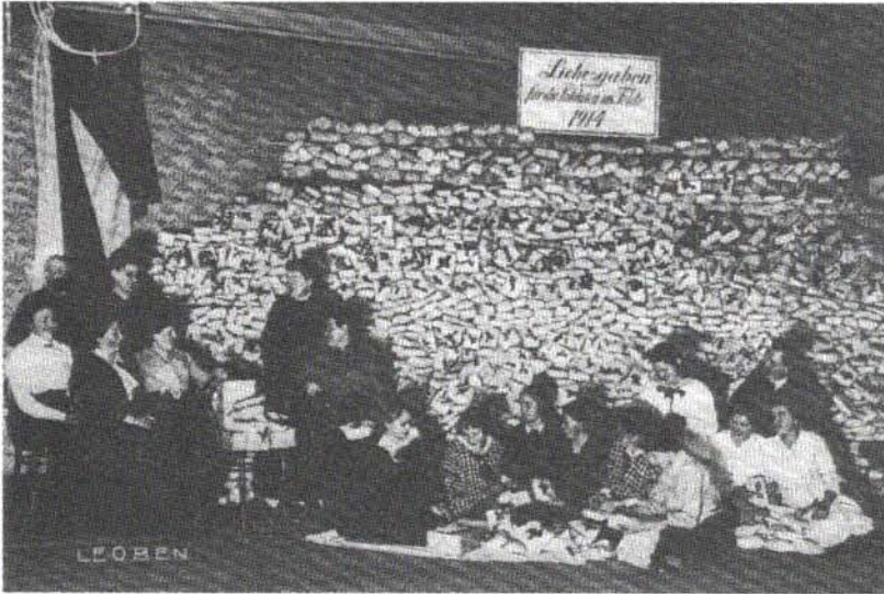
Abb. 2: Sammlung von Liebesgaben, aus: Denscher, Gold, wie Anm. 8, 11.

Versorgung der Soldaten, zur psychischen Reproduktion der an den Fronten kämpfenden Soldaten beitragen, aber eben doch nicht zu sehr. Es ist geradezu absurd: In der damaligen auf Kinder bezogenen Kriegspropaganda wurde nicht nur etwa an der Liebe zwischen Eltern und Kindern (Abb. 3), sondern ebenso und explizit am Muster der Geschlechterliebe (Abb. 4) angeknüpft. Abgesehen davon konnotiert der auf die Mädchen daheim und die Soldaten an den Fronten bezogene „Liebes“diskurs dieses Muster, es ist ihm gewissermaßen als Paradoxon implizit. Als Folge der Bemühungen, Mädchen für den Krieg zu gewinnen, kam es dadurch auch zu von Erzieher/inn/en und Demagog/inn/en nicht intendierten Sehnsüchten und Hoffnungen, zu Liebesvorstellungen, die dem Krieg gefährlich werden, zumindest nicht kriegsfördernd sein könnten. Die nun folgenden Beispiele zeigen, daß es eben nicht immer diesselbe Form von „Liebe“ war, welche die strickenden Mädchen und Frauen sowie die Soldaten einerseits und die Agent/inn/en der staatlichen und kommunalen Kriegsfürsorge andererseits jeweils meinten.