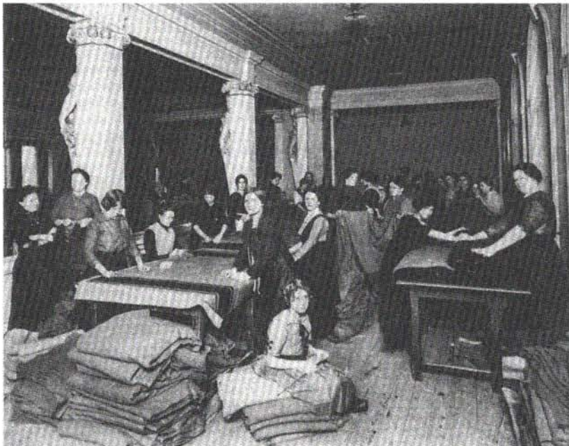
Abb. 5: Nähstube für Kriegsdecken, Foto des Heeresgeschichtlichen Museums, Inv. Nr. 39.558/5, aus: Svoboda, Soldaten, wie Anm. 13, Kat. Nr. 390.

stuben der Kontext zu jenem kriegerischen Begriff von „Liebe“ erspart. In den Pelz-, Näh- und Strickstuben verarbeiteten sie gespendete Liebesgaben , die u.a. von den genannten Sammelwagen eingebracht worden waren. Das in Abb. 6 reproduzierte Plakat „Der Sammelwagen kommt wieder!“ ruft zur Spende auch textiler „Liebesgaben für die Soldaten und ihre Angehörigen“ auf. Daß diese für die betreffenden Frauen der Unterschichten eine grundsätzlich andere, ökonomische, die karge Existenz sichernde Bedeutung hatte, eine andere als für die handarbeitenden Mädchen, die bürgerlichen Initiatorinnen und Leiterinnen der Arbeitstuben und die Spender/innen von Liebesgaben , muß sicher nicht ausführlich betont werden.