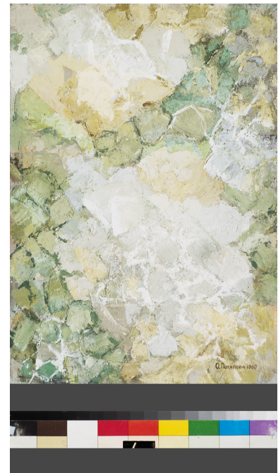
// Abbildung 1 Olga Potapova: Steine , 1960

10) Näheres zu dieser Ausstellung: Gretchen Simms, The 1959 American national exhibition in Moscow and the Soviet artistic reaction to the abstract art , Diss. 2007 Wien; Kirill Chunikhin, The Representation of American Visual Art in the USSR during the Cold War (1950s to the late 1960s) , Diss. 2016 Bremen.