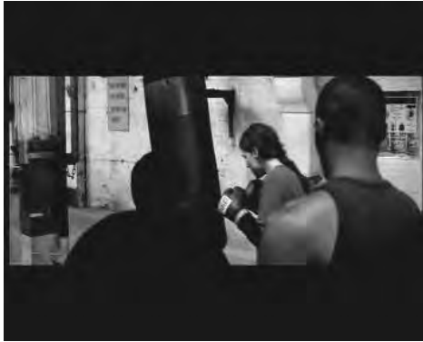
Abb. 1: (00:19:03) 10

im Gegenteil keine Rolle zu spielen. Vielmehr scheint Franks permanente Warnung, Maggie solle auf ihre Deckung achten, eher in Richtung Technik zu zeigen. Der Film lässt sich Zeit, die Widerstände und Vorurteile zu zeigen, mit denen Maggie kämpfen muss, sowohl bei der Arbeit als auch in der Trainingshalle.