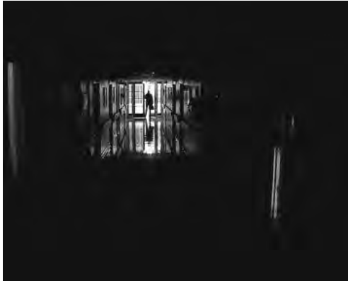
Abb. 6: (02:00:32)

Der Film zeichnet hier ein sehr düsteres Bild. Maggie hat nur Frank, ihre Familie ist unausstehlich, sie kann sich überhaupt nicht bewegen, muss beatmet werden und verliert Teile ihres Körpers. Und so kommt es zu der dramaturgischen Auflösung, die von zahlreichen Kritikern angegriffen worden ist: Auf Maggies Bitte hin, der sie durch Selbstmordversuche (sie schluckt ihre eigene Zunge) Nachdruck verleiht, tötet Frank sie. Und zwar nicht nur, indem er einen Stecker zieht, sondern indem er ihr eine Überdosis Adrenalin spritzt. De jure zählt dies als Euthanasie. Der Film endet damit, dass Frank für immer verschwindet. Wir wissen nicht, was mit ihm passiert und Scrap erzählt nur, was sein könnte, aber nicht sein muss.