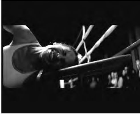
Abb. 5: (01:30:22)

Die Erwartung, die der Erzähl- und Spannungsbogen aufbaut, läuft auf den großen Kampf hinaus, den Million-Dollar -Meisterschaftskampf, und die große Wende bzw. Überraschung im Film. Ein Happy End würde natürlich Maggies Sieg zeigen, und damit angeblich einen weiblichen „Rocky“. Entgegen eines weitverbreiteten Irrtums der Rezensenten würde Maggie den Kampf aber selbst als Rocky verlieren, der seinen ersten Meisterschaftskampf auch verliert. Allerdings ist „verlieren“ das falsche Wort, denn der Film zeigt deutlich Maggies Überlegenheit im Kampf; und eine reine Niederlage ohne weitere Komplikationen hätte aus dramaturgischer Perspektive eine klar anti-klimaktische Wirkung. Maggie verliert nicht, sie wird gefoult während sie anstatt zu ihrer Gegnerin zu Frank sieht und fällt durch einen unglücklichen Zufall mit dem Nacken auf den Pausenhocker, den Frank nicht schnell genug wegnimmt. Wie Tschechows berühmte Waffe an der Wand geht die im Film immer wieder betonte Warnung „Achte auf die Deckung!“ los, mit katastrophalen Konsequenzen: Maggie ist vom Kopf abwärts gelähmt. 14