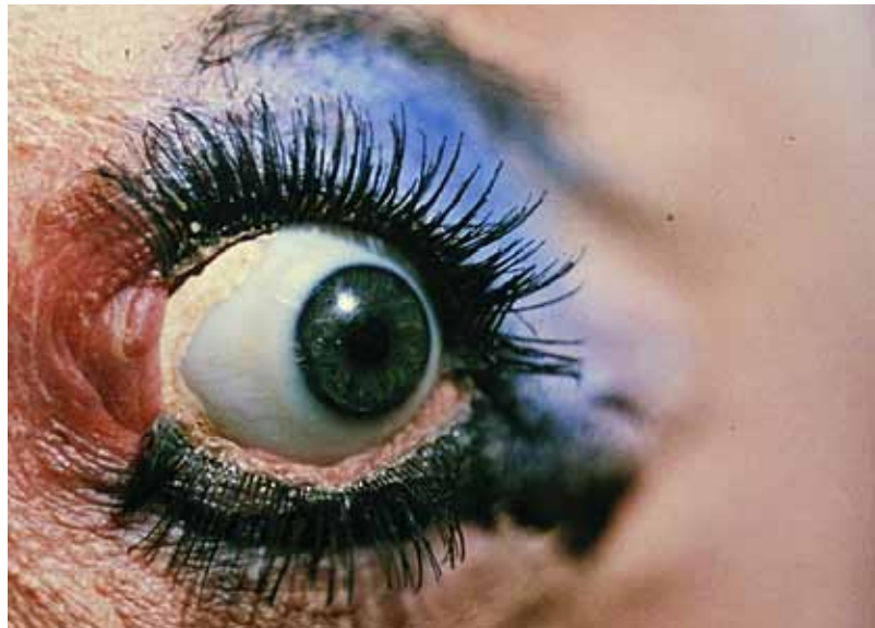
// Abbildung 01

Es gibt nur eine Szene, in der für einen kurzen Moment fast der ganze nackte Körper der Künstlerin auf der Bildfläche erscheint (0:52 min). Breitbeinig, halb aufgestützt auf dem Rücken liegend, taucht der Kopf der Künstlerin weiter hinten im Bild über den Brüsten auf. Deutlich sind zwischen den Beinen im Vordergrund das vertikale Vulva-Auge und der Anus zwischen den angeschnittenen Schenkeln zu erkennen. Die Aufnahme dauert jedoch nur eine Sekunde und wird wiederum durch Nahaufnahmen des Genitals abgelöst.