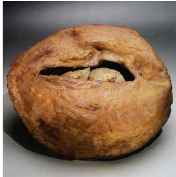
// Abbildung 02

Die Künstlerin Louise Bourgeois entwirft 1966 ein Objekt, das in seiner Uneindeutigkeit ebenfalls Widerwillen auslösen kann. Die rundliche Plastik mit dem Titel Le Regard (Der Blick) weist in der Mitte einen vulvischen Schlitz auf, wie bei einem Katzenauge.