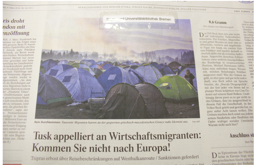
// Abbildung 4 FAZ v. 04.03.2016

(3) DIE QUADRATUR DES LEBENS – MENSCHEN IN VERWALTETEN RÄUMEN (SAMMELUNTERKÜNFTE, ZELTE, KASERNEN, TURNHALLEN) — Aufgrund der Entwicklungen im Sommer der Migration und danach veränderten sich mit den Wanderbewegungen der Geflüchteten die medialen Abbildungen. Während des March of Hope herrschten dementsprechend noch Bilder der Igluzeltstädte und von Menschen unter freiem Himmel vor. Je weiter die Menschen jedoch voran- und in Deutschland ankamen, desto häufiger tauchten Bilder von Sammelunterkünften, Kasernen und Turnhallen auf, die zu einem zentralen Diskursstrang wurden. Innerhalb dieser Motivgruppe sind zwei Darstellungsweisen voneinander zu unterscheiden: die Abbildung der menschenleeren