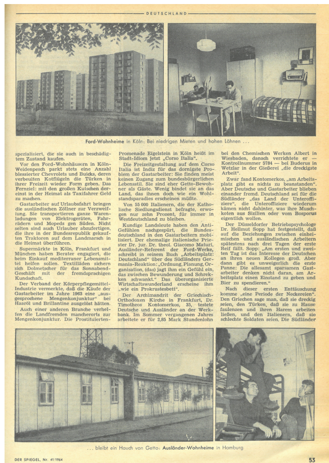
// Abbildung 1 SPIEGEL (1964), H. 41, 1964, S. 53

Ganz anders im „Ausländerwohnheim“. Hier befindet sich der/die Betrachter*in inmitten des Geschehens in einem Schlafraum mit Doppelstockbetten. Umgeben ist die Kamera und mit ihr der/die Betrachter*in von auf den Betten sitzenden Männern, fotografisch halb angeschnitten, Beine baumeln vom Bett, womit Enge sowie fehlende Privatheit und Distanz visualisiert werden. Dieser visuelle Eindruck wird durch den Text im Artikel verstärkt: