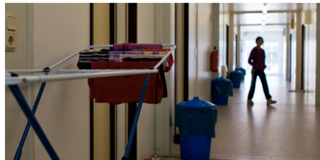
Flur in einer Unterkunft: privat oder nicht? Darüber streitet der Stadtrat in Hannover.

Vier CDU-Politikerinnen haben in Hannover unangemeldet eine Flüchtlingsunterkunft inspiziert und eine Debatte über Privatsphäre ausgelöst.