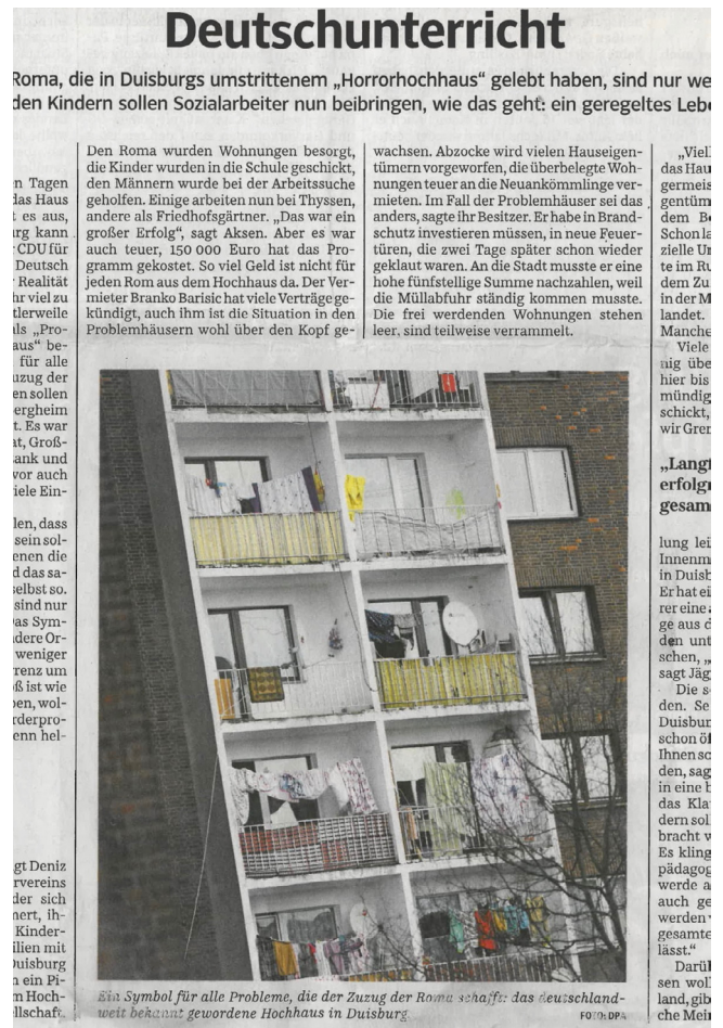
// Abbildung 2 Süddeutsche Zeitung v. 29.04.2014, S. 10

— Zweierlei fällt auf: Die Perspektive ist so gewählt, dass die Senkrechte aus dem Lot geraten ist – und mit ihr, so der visuelle Subtext, die gesellschaftliche Ordnung. Sie ist ins Wanken, aus den Fugen geraten; nicht nur das Haus (hier sinnbildlich für das Haus Deutschland als beherbergender Nationalstaat), sondern auch die gesamte Situation droht zu kippen. In unverhohlenem Rassismus und Antiziganismus erfahren die Leser*innen im Text von der kriminellen Energie der „Clans“, die ihre