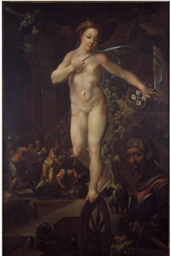
// Abbildung 2 Matthäus Gundelach, Allegorie des Bergbaus (ca. 1620)

„Ein bawender Gewercke beym Bergwerck muß eine starcke Hoffnung auf reiche Außbeute haben / wiewol es geschiehet / daß man bey seiner guten starcken Hoffnung offft betrogen wird