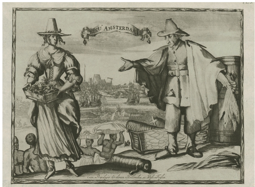
// Abbildung 1 Nieu Amsterdam (um 1650)

I. N. Phelps Stokes, in dessen Sammlung in der New York Public Library sich der Stich befindet, datierte den Stich auf 1643, allerdings versehen mit einem Fragezeichen. Firth Haring Fabend hingegen datiert die Entstehung des Kupferstichs auf 1653/54. Zur genaueren Datierung sowie weiteren Informationen zum Kupferstich siehe ausführlich Fabend 2004.