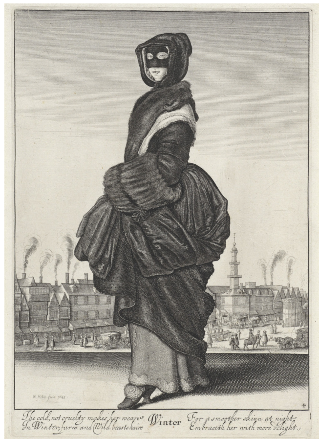
// Abbildung 2

— Die Versorgung des geplanten Handelsstützpunktes in Nordamerika gestaltete sich jedoch zunächst schwierig. In van Meterens Reisebericht ebenso wie vor allem in denjenigen, die um die gezielte Besiedlung Manhattans und des Hudson Valleys in den 1620er Jahren veröffentlicht wurden, wird deutlich, dass das Bedürfnis, sich in New Amsterdam und Umgebung anzusiedeln