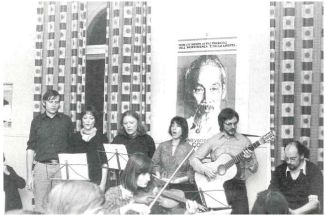
// Abbildung 2

Auch Valie Export's frühe Performance Tapp- und Tastkino will mit einer ähnlichen Stoßrichtung das Kino „als Projektionsraum männlicher Phantasien“ vorführen, wobei hier die taktile Rezeption gegen die Herrschaft des Bildes und des Voyeurismus ausgespielt werden soll (vgl. Export 1968).