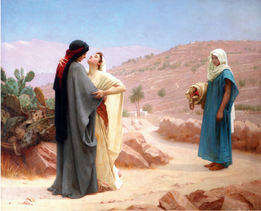
ABBILDUNG 7 Philip Hermogenes Calderon, Rut und Noomi , 1886, Walker Art Gallery, Liverpool

Gerade dort, wo sich eine Frau als Hauptfigur in einem biblischen Text durch ihre Treue (דַּחַקָּה) auszeichnet, ist die Rede von einer Bindung einer Frau an eine andere Frau. Aus damaliger wie heutiger Sicht kann nicht ausgeschlossen werden, dass die Beziehung Ruts, „der Freund_in“, zu Noomi, der „Lustvollen“, als erotisch motiviert verstanden wird. Herkömmlicherweise wird Ruts Verhalten als vorgelebte, selbstlose Solidarität mit ihrer verarmten, verbitterten Schwiegermutter interpretiert, an der sich Leser_Innen ein Beispiel nehmen sollen. Rut zeigt, was es heißt, sich bedingungslos für einen anderen Menschen zu engagieren. Ich teile nicht die Ansicht, einen absoluten Widerspruch zwischen Ruts vorbildhaftem solidarischem Handeln und einem, welches aus erotischer Attraktivität Noomis resultieren könnte, zu sehen. 37 Vielmehr könnte Ruts Zuwendung zu Noomi zum Beispiel im Sinne von Audre Lorde's Verständnis von Erotik als Macht gelesen werden: 38 Wenn eine Frau