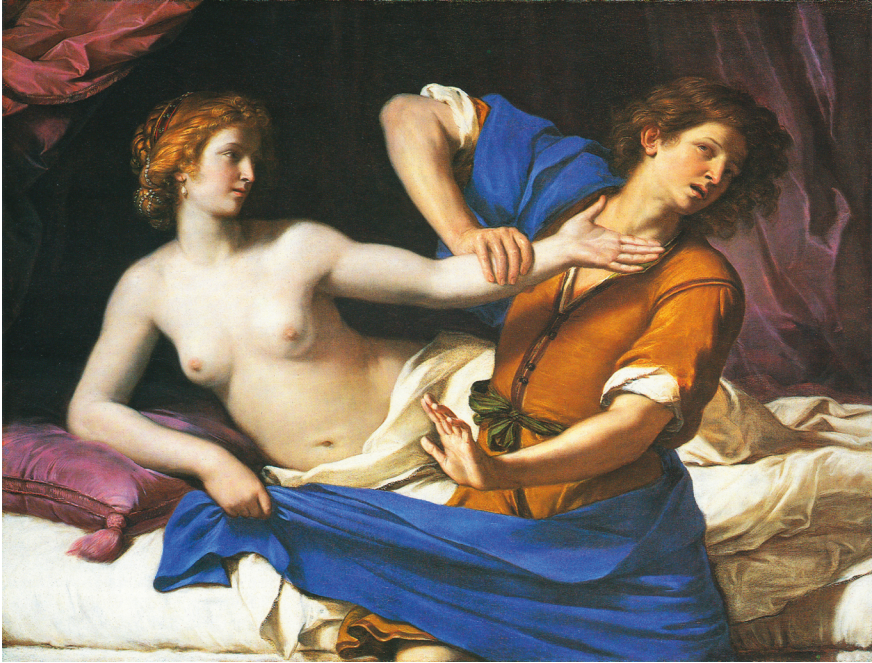
ABBILDUNG 2 Giovanni Francesco Barbieri (Guercino), Josef und Potifars Frau , 1649, National Gallery, Washington, DC

den sexuellen Annäherungen eines anderen Manns genauso begegnet. 203 In Guercinos Malerei mag es fast irritierend wirken, dass Josef nicht den liebevollen Blick von Potifars Frau erwidert, die hier nicht etwa als böses Weib gezeigt wird. Stattdessen hat er Panik. Warum blickt er gen Himmel? Wird denn von dort Hilfe kommen? Es bleibt offen, ob der Maler hier eine moralische Überlegenheit und Tugendhaftigkeit Josefs darstellt oder doch eher Horror vor der schönen Frau und ihren sexuellen Absichten, was theoretisch aus seinem mangelnden sexuellen Interesse an Frauen resultieren könnte.