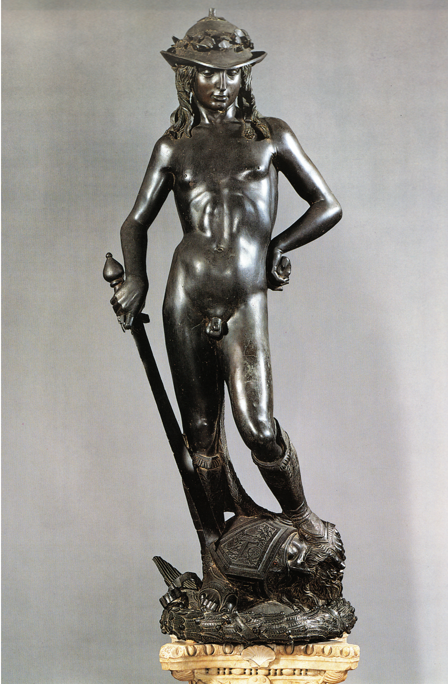
ABBILDUNG 3 Donatello, Bronzedavid , ca. 1440, Museo Nazionale del Bargello, Florenz