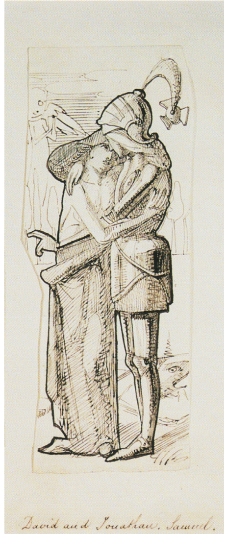
ABBILDUNGEN 5 UND 6 Simeon Solomon, David und Jonatan , 1854–1855, The Jewish Museum, London

„bei seiner Liebe“ schwören lässt, würde für viele wahrscheinlich eher zu einem Liebeslied wie dem Hohelied passen. In Hld 2,7 und Hld 3,5 wird aber „bei den Gazellen oder den Damhirschkühen des Feldes“ geschworen, was aus meiner Sicht als rein erotische, nicht religiöse Metapher anzusehen ist. 26