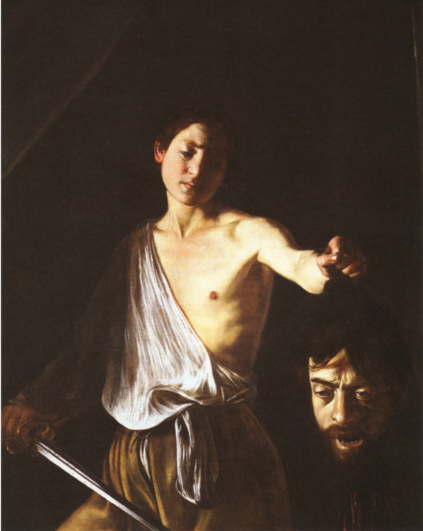
ABBILDUNG 4 Caravaggio, David mit dem Haupt des Goliath , 1609/10, Galleria Borghese, Rom

David, welchen er bereits als Amor in Amor als Sieger (Amore Vincitore) 48 im Jahr 1602 dargestellt hat. Dieser Junge ist inzwischen älter geworden und dementsprechend als David bereits erwachsener. Er sieht wie ein Sechzehn- oder Siebzehnjähriger aus. 49 Caravaggio könnte beim Malen die reale körperliche