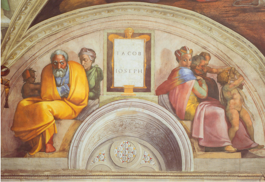
ABBILDUNG 1 Michelangelo, Jakob und Josef , 1508–1512, Sixtinische Kapelle im Papstpalast, Vatikanstadt in Rom

Bildbereich als „Heilige Familie“ (Maria, Josef und das Jesuskind) betrachtet. 32 Diese christliche Interpretation lehnt sich stark an Vers 16 im ersten Kapitel des Matthäusevangeliums an, welcher ein Teil des Stammbaums Jesu in Mt 1,1–17 ist: 33 „Jakob zeugte Josef, 34 den Mann Marias, von der Jesus geboren wurde, welcher Christus genannt wird [Ἰακώβ δὲ ἐγέννησεν τὸν Ἰωσήφ τὸν ἄνδρα Μαρίας, ἐξ ἧς ἐγεννήθη Ἰησοῦς ὁ λεγόμενος Χριστός].“ 35 Theologische Aussage des Stammbaums Jesu nach dem Evangelisten Matthäus ist folgende: Jesus