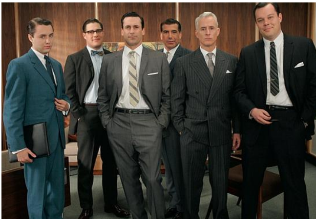
Abb. 3: Jungs, es reicht! (vgl. o.A.2013: 18)

Der Vergleich verkleinert das zur Diskussion stehende Problem. Am Ende handelt es sich lediglich um eine Geschmackssache. So kann vom systemischen Charakter des Sexismus abgelenkt werden, den wiederum EMMA hervorhebt. Für die feministische Zeitschrift handelt es sich bei Sexismus um ein altes, geradezu systemimmanentes Phänomen. Wenig habe sich bislang geändert, suggeriert die EMMA u.a. durch die Illustrierung ihres Themenschwerpunktes. Zu sehen ist eine Gruppe von Männern, die Macht demonstrieren. Es handelt sich um die Darsteller der US-amerikanischen TV-Serie Mad Men (seit 2010). Mad Men spielt in den 1960er Jahren und erzählt vom Aufstieg der Werbeindustrie am Beispiel einer fiktiven Werbeagentur. Das soziale Miteinander bzw. Gegeneinander ist von Hierarchien geprägt, gerade auch Geschlechterhierarchien sind offensichtlich. Die Frauen sind in dieser Serie überwiegend in untergeordneten Positionen angesiedelt, treten als Hausfrauen und Mütter oder Sekretärinnen auf. Sexuelle Belästigung ist an der Tagesordnung.