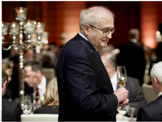
Partypast Brüderle beim Festessen des BDI am 29. Januar in Berlin: Er will, dass das Thema verschwindet

Dass Brüderle ein Mann von gestern ist, der zwanghaft Herrenwitze reißt und als Wahlkämpfer nicht taugt, ist die andere Sichtweise der Medien. Sie verzichtet darauf, Brüderle in irgendeiner Weise als schwach oder bemitleidenswert darzustellen. Im Gegenteil wird das „Gehabe eines Politikers“ (Kosser 2013: 28) kritisiert, „der meint, kraft Amtes ein Recht auf sexuelle Annäherung zu haben.“ (Ebd.) „[D]ieser Mann [ist] anscheinend ein notorischer Frauenanbaggerer auf Stammtischniveau [und] dieser alte neue Spitzenkandidat der FDP ist ein Mann von gestern.“ (Schwarzer 2013b: 7; Schwarzer 2013a: 27) Brüderle reiße aber nicht nur nachts „zwanghaft Herrenwitze“ (Voss 2013: 25), „tagsüber bezeichnet er den Euter einer Kuh als ‚Körbchengröße L‘“. Dass Laura Himmelreich daraus schließt, Brüderle stehe als Wahlkämpfer nicht für einen Aufbruch und Neubeginn, betrachtet die FAZ als legitimen Schluss (vgl. Voss 2013: 25). Damit positionieren sich EMMA und die FAZ deutlich kritischer gegenüber Brüderle und stützen eher die Sichtweise Himmelreichs. Der Spiegel , der um Verständnis für Brüderle wirbt, negiert nicht etwa Brüderles Interesse an Geselligkeit, wie das folgende Bild belegt, nur wird der Eindruck erweckt, dass Männer nun einmal so sind und dass das alles doch sehr menschlich sei: Schließlich wollte sich Brüderle an diesem Abend einfach nur „[...] amüsieren und reden, über alles, nur nicht über die FDP und deren desolaten Zustand.“ (Hoffmann 2013a: 32) Wieso also diese Aufregung?