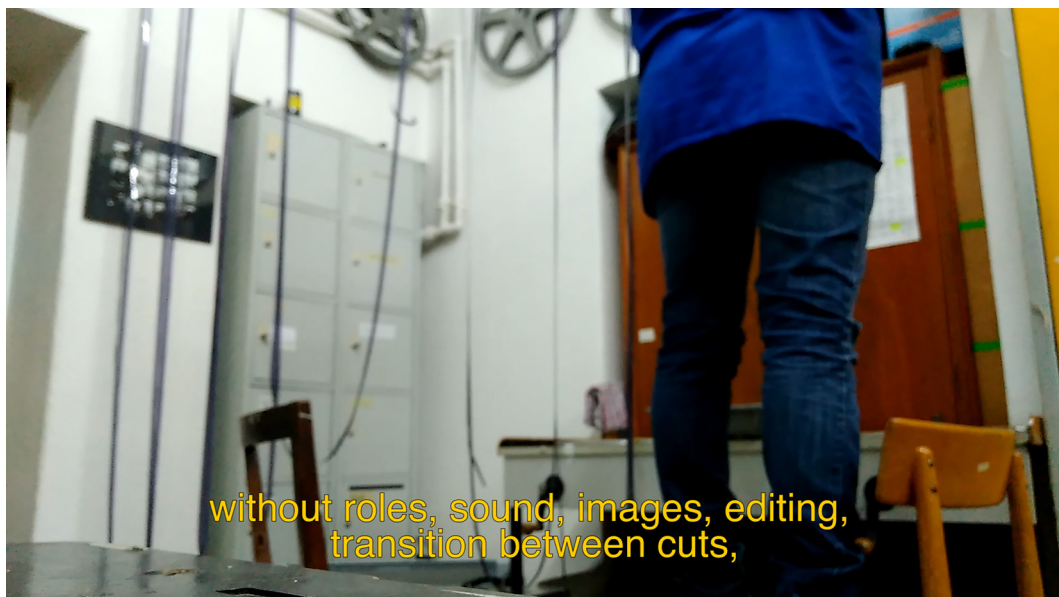
Abbildung 10: Godovannaya

Quelle: „Countryless and Queer“ (Masha Godovannaya 2020)