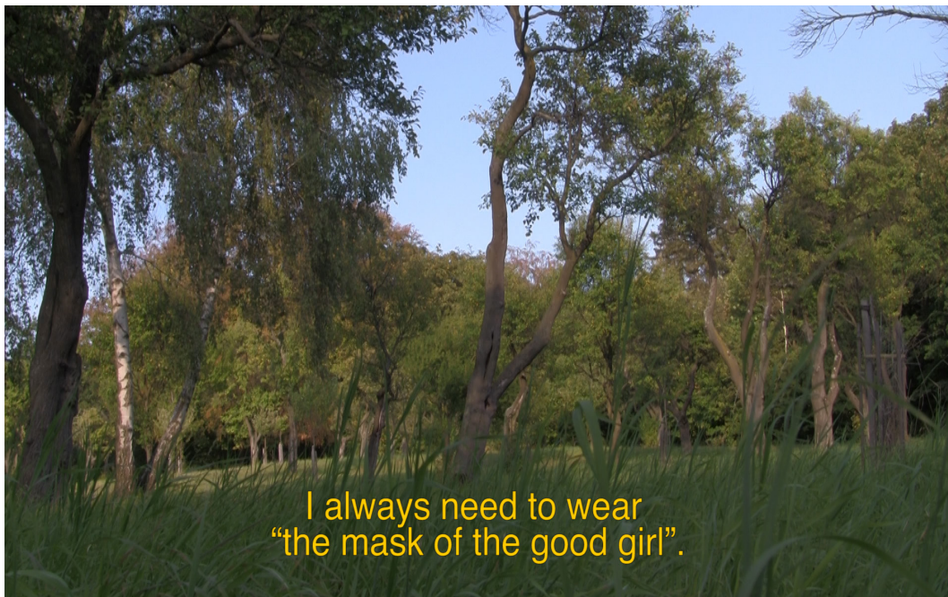
Abbildung 1: Die Maske des braven Mädchens

Quelle: „Countryless and Queer“ (Masha Godovannaya 2020)