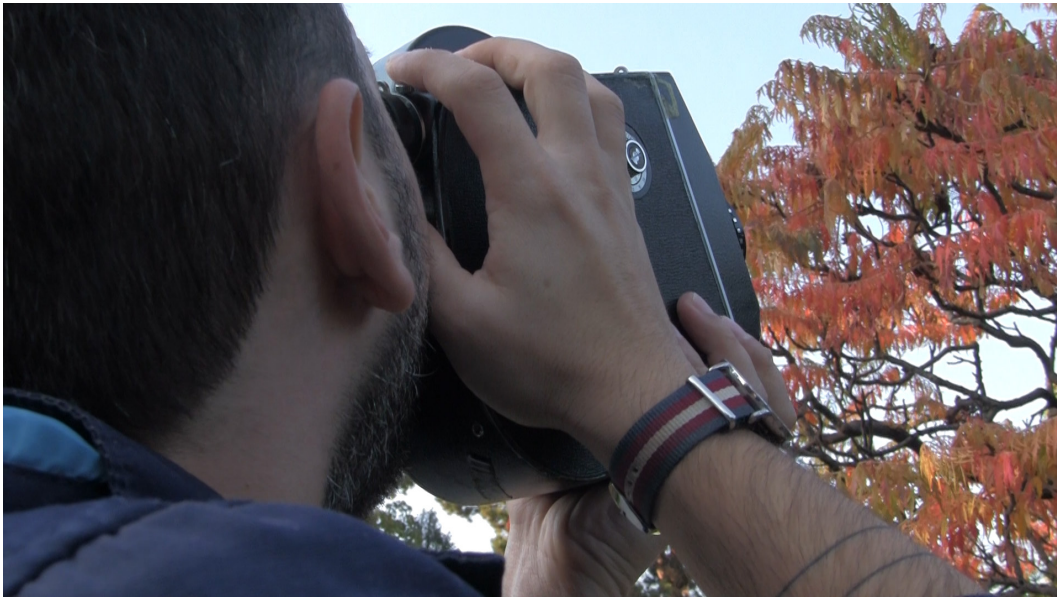
Abbildung 3: Akteur 1 hinter der Kamera