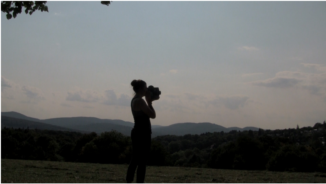
Abbildung 5: Akteurin 3 hinter der Kamera