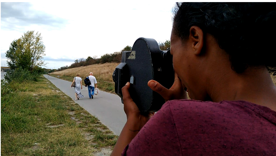
Abbildung 4: Akteurin 2 hinter der Kamera