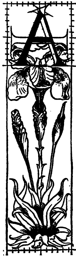
Blumenfeld, in welchem die Kunst und Wissenschaft des rechten und wahren Verhältnisses der Buchstaben zu dem Leib und Antlitz des Menschen enthalten sind. Geoffroy Tory, 1520