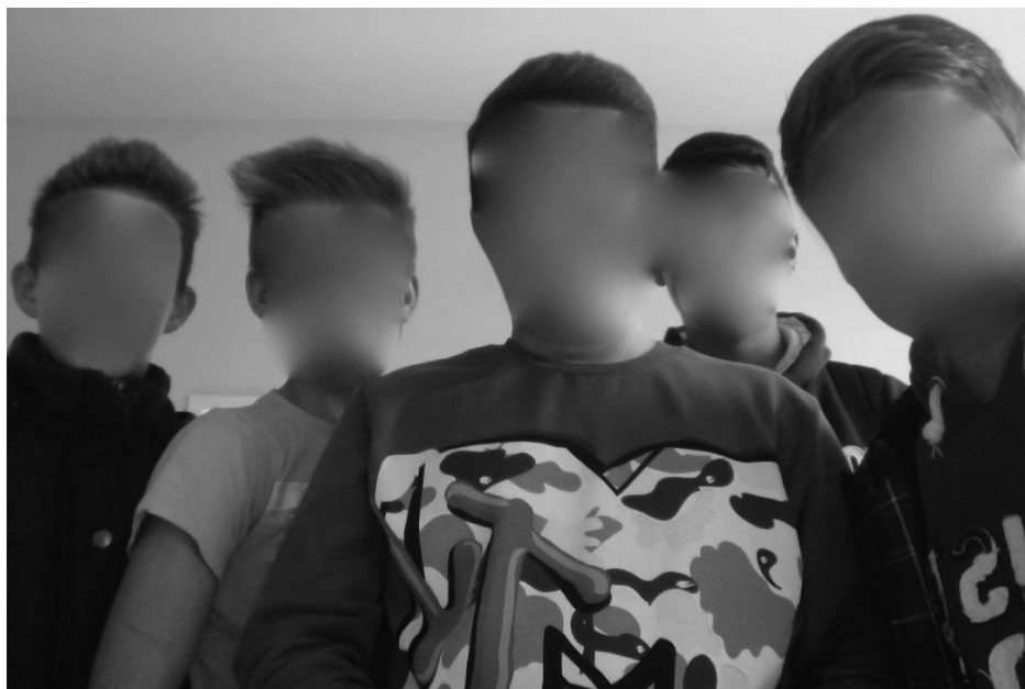
Abbildung 2: Selfie der fußballbegeisterten Rapper