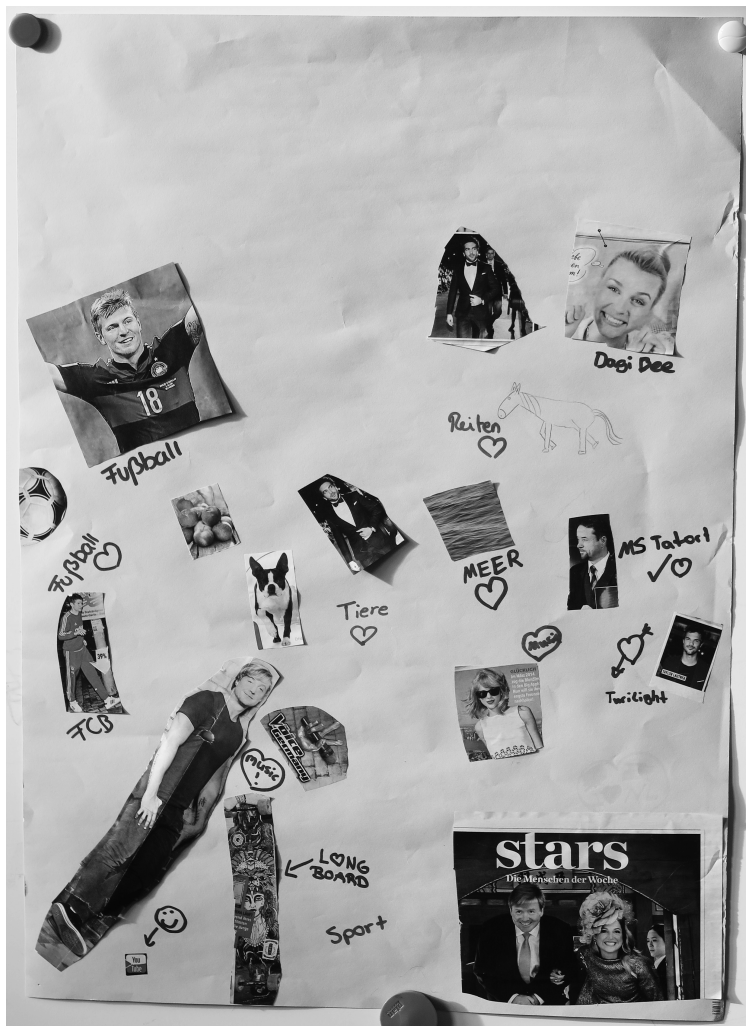
Abbildung 3: Collage der wertkonservativen Tierliebhaberinnen