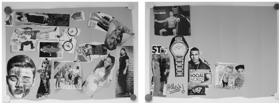
Abbildung 1a und b: Collage der fußballbegeisterten Rapper