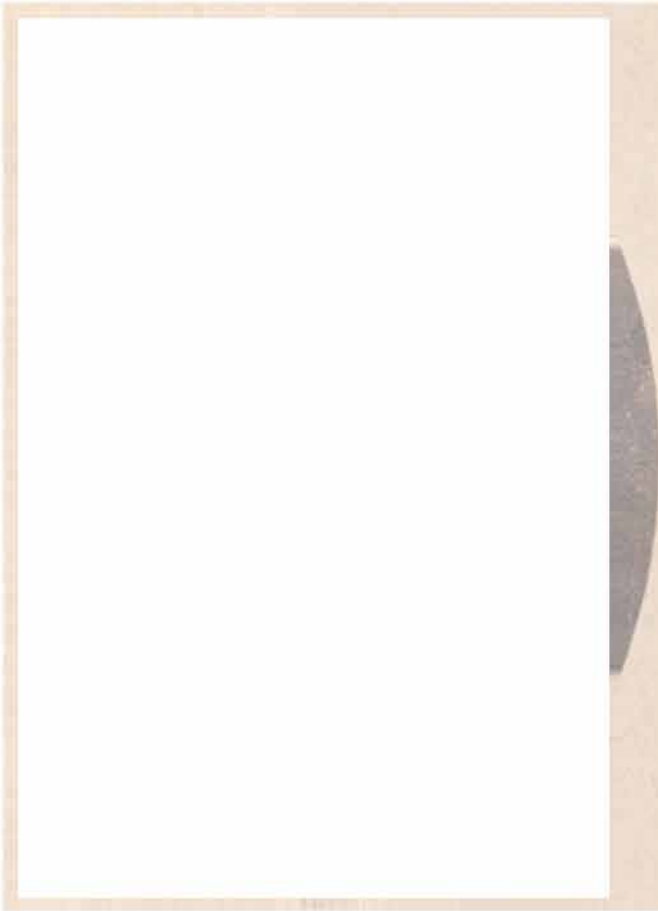
Altersbild von Louise Otto-Peters, Fotografie (Louise-Otto-Peters-Archiv Leipzig)

fänglichkeit für das Große und Schöne, erregbare Phantasie und eine emporstrebende ideale Richtung – vor allem aber die selbstlose, opferfreudige Liebe der Frauen. 100