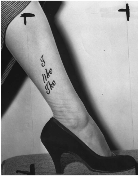
Abb. 1: I like Ike -Nylonstrümpfe

Obwohl Frauen in den USA seit 1920 das Wahlrecht hatten, wurden sie erst in den Wahlkämpfen der 1950er Jahre als Wählerinnen mit eigenen Interessen wahrgenommen (vgl. Römmele 2005: 28) und gezielt als politische und modische Konsumentinnen beworben (vgl. Mayo 1992: 152). Dies geschah durch Campaign-girls, die Wahlkampf für diverse republikanische und demokratische Kandidaten machten. Für die Aufladung und den Transfer politischer Werbebotschaften in das Medium der Mode waren die von den Walt Disney Studios für Dwight David Eisenhower konzipierten I like Ike -Kampagnen 1952 und 1956 wegweisend. Die Ausstattung der Ike Girls mit modischen New Look -Kleidern und Nylonstrümpfen mit I like Ike -Aufdrucken (Abb. 1) brachten begehrte Mode und Accessoires in den an Frauen adressierten politischen Werbekontext ein und generierten so Wählerinnen für Eisenhower.