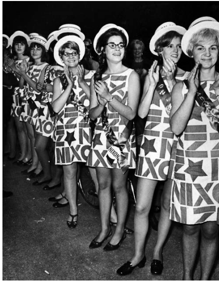
Abb. 4: Nixonettes in Papierkleidern