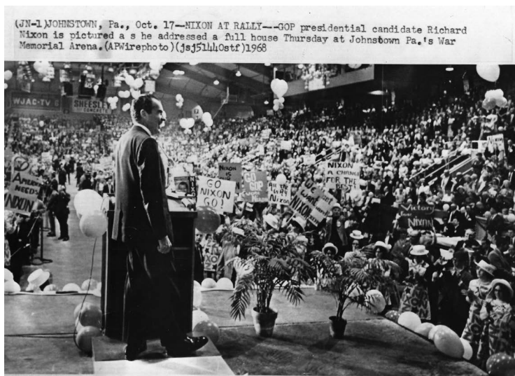
Abb. 5: Nixons Auftritt in Johnstown am 17. Oktober 1968

Damit zeigt sich eine Doppelperspektive der Nixon-Papierkleider. Sie schaffen nach außen einen popästhetischen Youth -Körper als Verjüngungsstrategie des Kandidaten und gleichzeitig einen identitätsstiftenden Zusammenschluss zum Gruppenkörper der Nixonettes.