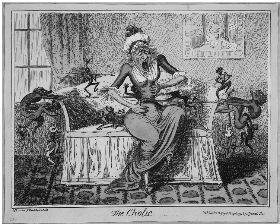
Abbildung 2: The Cholic

Quelle: George Cruikshank, 1819. Radierung altkoloriert. London Britisches Museum, 1862-12-17-511.