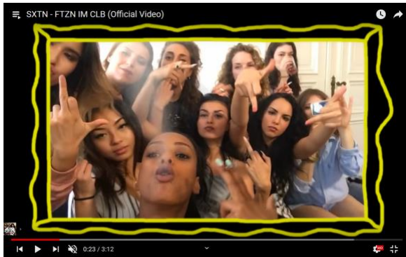
Abbildung 2: Vereintes Frauenkollektiv

Mittelfinger in die Kamera strecken (0:23) (Abb. 2).