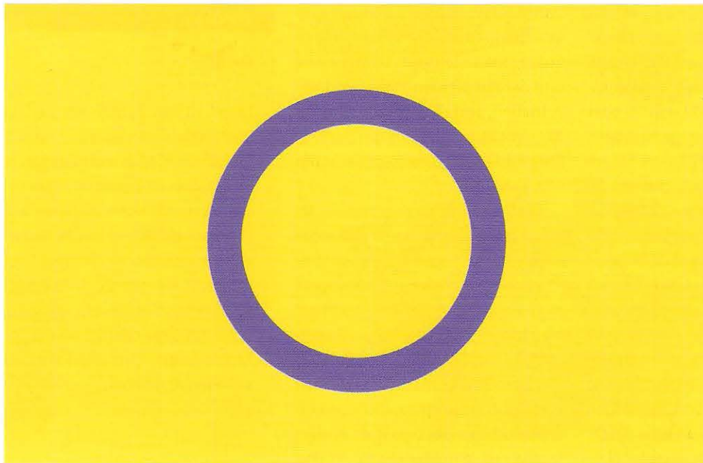
Abb. 4: Das Symbol der Inter*- Community

tergeschlechtlichkeit thematisiert wird und Inter* angst- und diskriminierungsfrei leben und lernen können. Die folgenden Aspekte sollten dabei in den Fokus genommen werden.